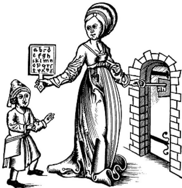
Рис. 1. Мудрость, держащая хорнбук и открывающая дверь в Знание ученику

которого сохранились до наших дней, собирались рыцари Круглого стола во главе с королем Артуром – главным героем британского эпоса и рыцарских романов.