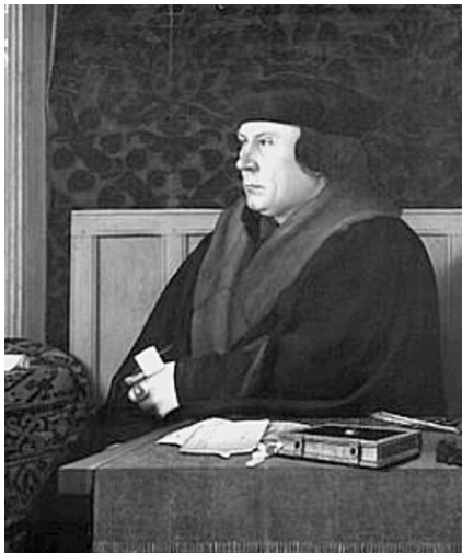
Рис. 9. Томас Кромвель

Внук кузнеца, сын пивовара и кабатчика, Томас Кромвель (ок. 1485–1540) рано покинул отчий дом и начал вести полную приключений жизнь в Англии и на континенте. Он служил наемником во французской армии, был банковским клерком в Италии, доверенным лицом английских купцов в Нидерландах, торговцем тканями, успешным лондонским адвокатом и, наконец, секретарем и правой рукой всемогущего Томаса Уолси (ок. 1473–1530), архиепископа Йорского, кардинала и Лорда-канцлера.