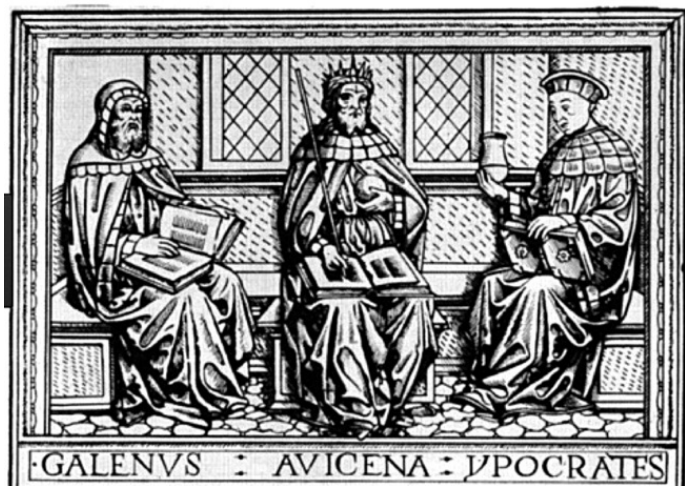
Рис. 2. Гален, Авиценна и Гиппократ

ти книг, составлявших библиотеку медицинского факультета Сорбонны в 1395 году)