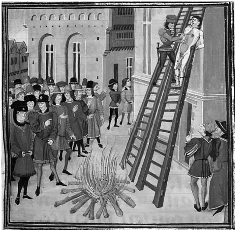
Рис. 8. Казнь «потрошением»

После смерти Хоутона место приора Чартерхауса оставалось вакантным. Среди тех, кто хотел бы его занять, был Эдмунд Хорд, который еще в начале сентября 1534 года счел необходимым письменно обратиться к королю с заверением