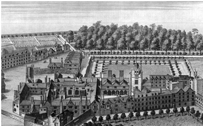
Рис. 6. Чартерхаус

Устав Ордена своей строгостью, вероятно, не уступал (а в чем-то и превосходил) Уставы других религиозных сообществ. От монахов требовались полный уход от мира, созерцательная жизнь в почти полном безмолвии и уединении в келье, суровый аскетизм, постоянное молитвенное служение. В обычные дни картезианцы собирались в Храме монастыря трижды в день на общие молитвы, совокупно длившиеся около трех часов; другие же молитвы читались в келье или за трудами (уход за садом, хозяйственные работы, составление или копирование духовных сочинений и так далее). Члены Ордена были обязаны носить под рубашкой власняницу и отходить ко сну в восемь часов вечера, причем каждый из них должен был повесить на спинку кровати похорон-