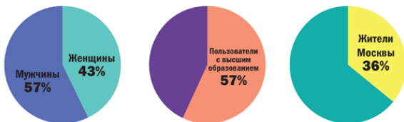
Рис. 5. Российская аудитория Telegram

В Telegram – активная продвинутая аудитория. Самый большой возрастной сегмент – от 18 до 34 лет, 43 % – женщины, 57 % – мужчины (данные актуальны на апрель 2018 г.). 57 % пользователей имеют высшее образование. Это жители крупных городов (36 % приходится на Москву), опытные специалисты со стабильным доходом 4 .