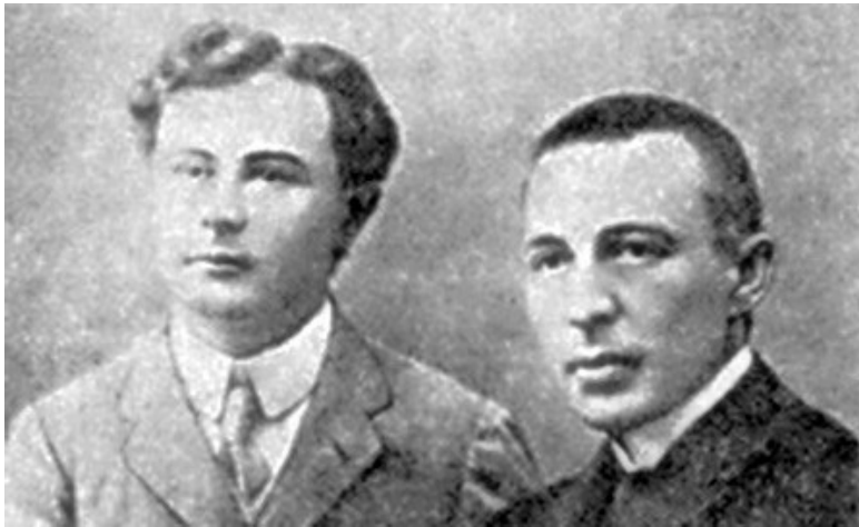
И. Гофман и С. В. Рахманинов

Гофман – первоклассный виртуоз, Это слишком известно, чтобы повторять. И, тем ее менее, каждый раз, как приходится слышать эти необыкновенные трели, это легкое, ласкающее piano и невероятное, чудовищное fortissimo , могучее, как целый оркестр труб и литавр, – невольно повторяешь: Гофман – первоклассный виртуоз.