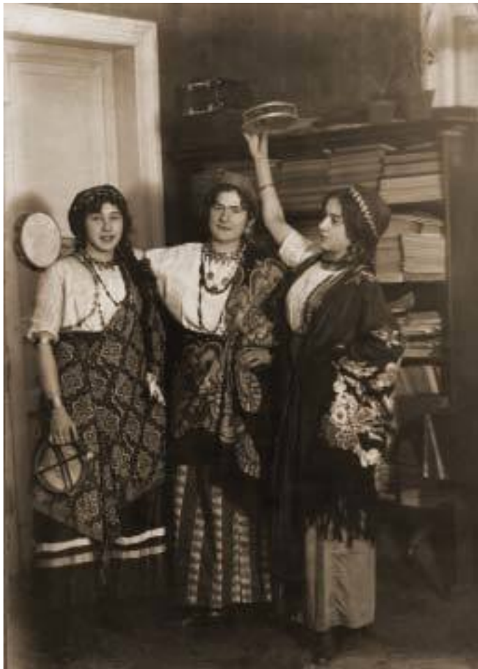
Веселый маскарад у Савиновых