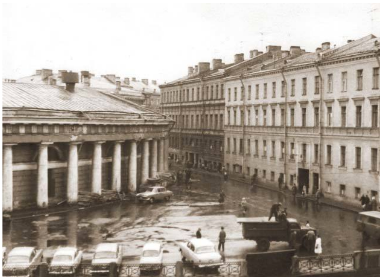
Вид из наших окон. 1960-е годы