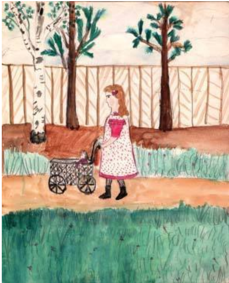
Прогулка. Рисунок Кати Савиновой. 1909 год