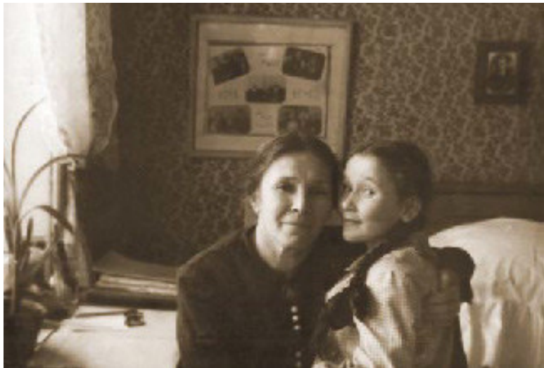
Бабушка и я. 1950-е годы