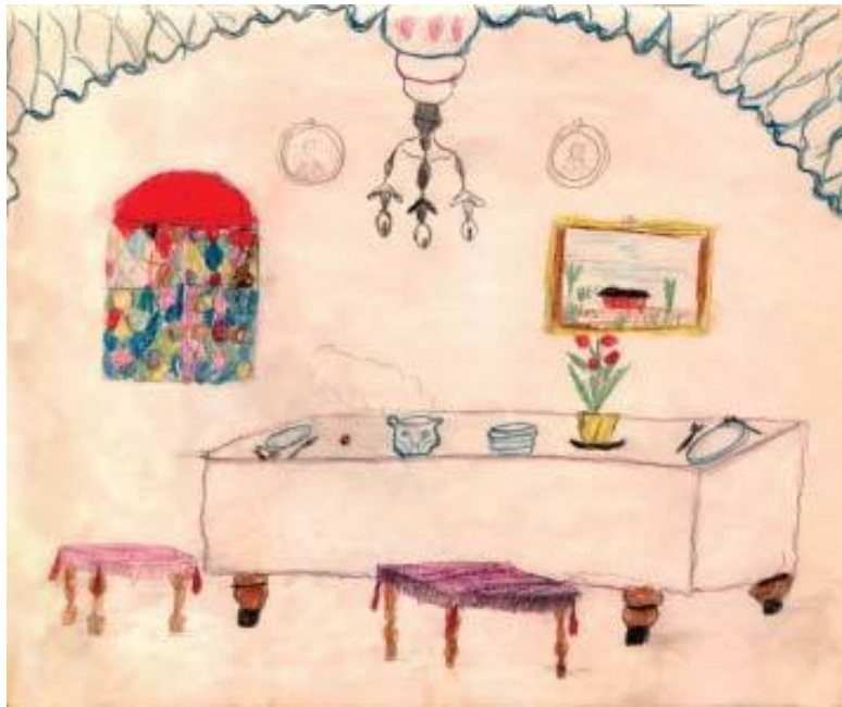
Столовая. Рисунок Кати Савиновой. 1909 год