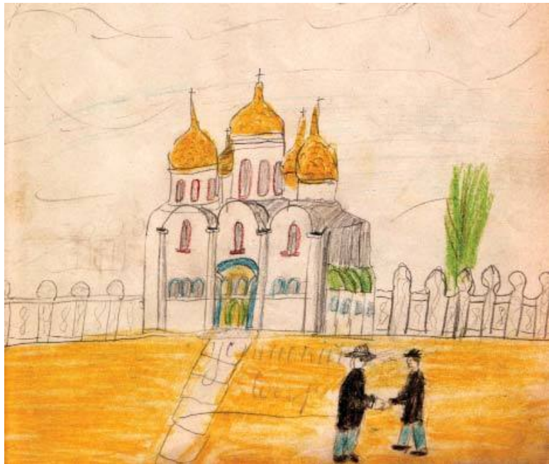
Успенский собор. Рисунок Кати Савиновой. 1909 год