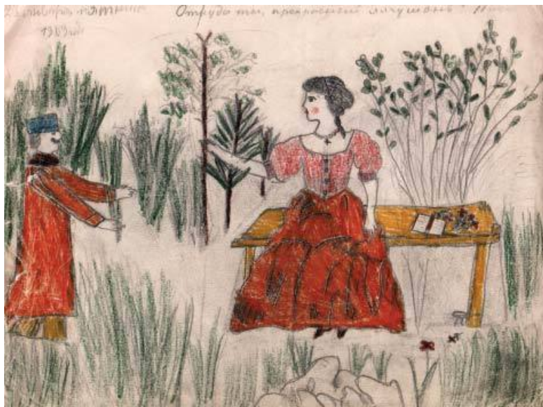
Встреча в саду. Рисунок Кати Савиновой. 1909 год