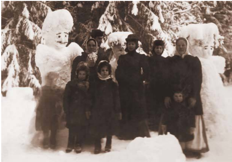
Прогулка в Павловском парке. Начало XX века