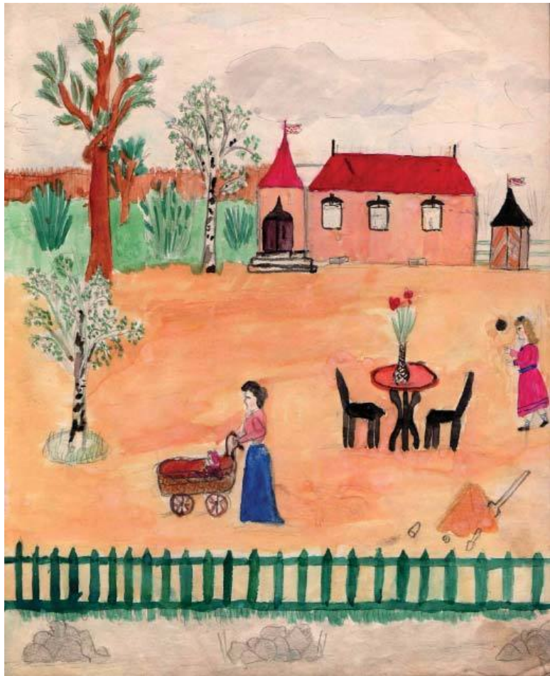
Дачная идиллия. Рисунок Кати Савиновой. 1909 год