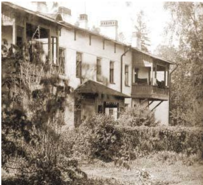
Дом для сотрудников обсерватории, Павловск. Начало XX века