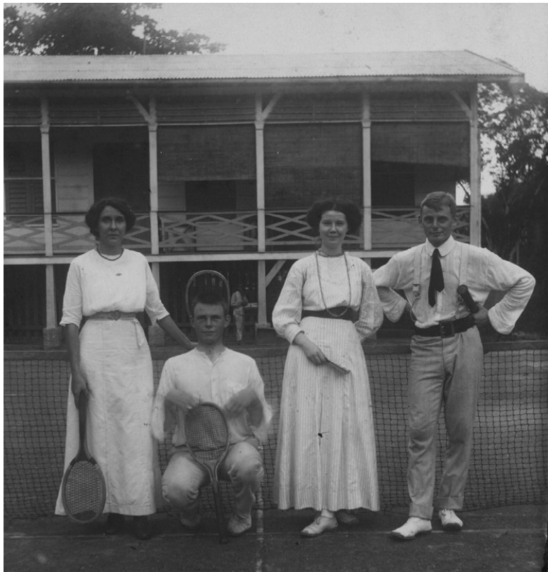
Группа теннисистов на корте в г. Парамарибо (Суринам). 1912. Groepsfoto van vier personen op de tennisclub, anonymous, 1912. Gift of B. Feith-Schnitger, Vorden. The Rijksmuseum