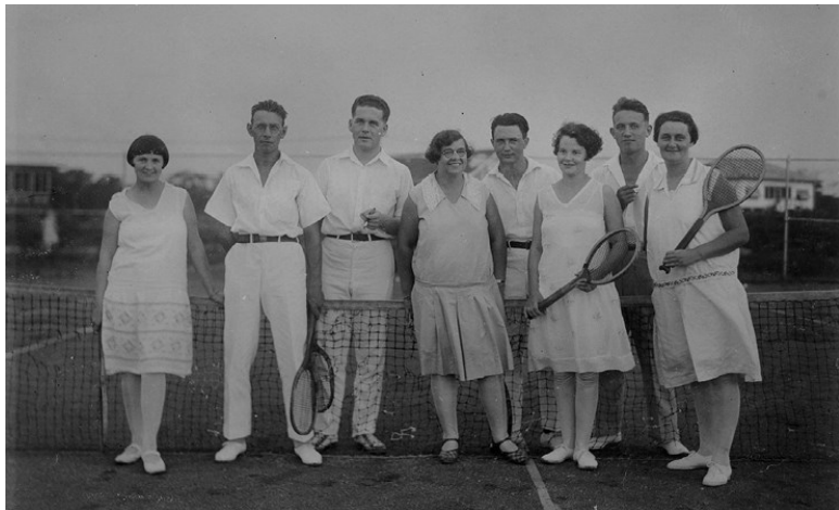
Группа теннисистов на корте в г. Мунго (Суринам). 1929–1930. Groepsportret op de tennisbaan van Moengo, anonymous, 1929–1930. Purchased with the support of the Maria Adriana Aalders Fonds/Rijksmuseum Fonds