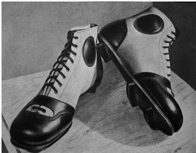
Футбольные бутсы с полосками из кожи вместо шипов.

го была разработана довольно сложная система: «Правильно зашнуровать футбольный башмак – тоже не простое дело. Доверху шнуровать не надо – это стеснит движения ступни. Нужно плотно зашнуровать башмак до конца подъема, затем обернуть шнурок вокруг щиколотки, перекрестить на подъеме, пропустить под подошвой, вновь перекрестить на подъеме и завязать сзади щиколотки. При таком способе башмак будет сидеть плотно и не стеснять движения ноги» (Ромм 1930: 23).