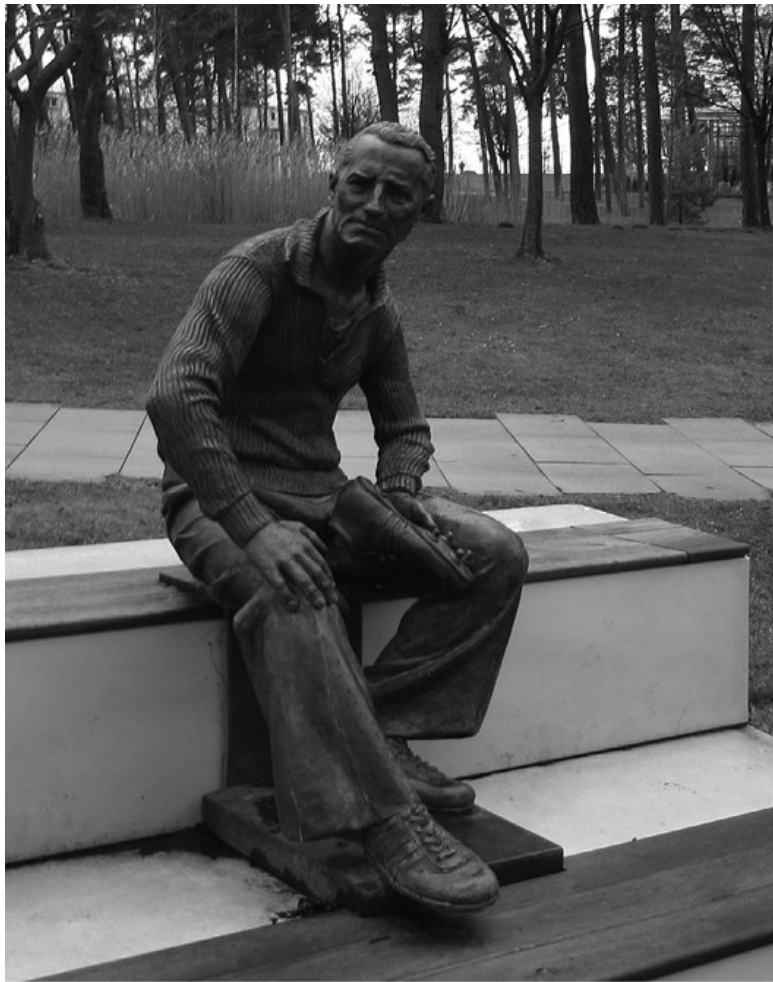
Статуя Ади Дасслера в штаб-квартире компании adidas в Херцогенаурахе (Германия). Скульптор Йозеф Табачник.