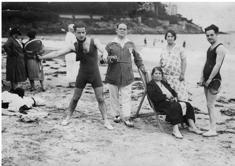
Отдыхающие на пляже. Почтовая открытка. 1928 (датировка по подписи на обороте).

вплоть до 1930-х годов пляжный гардероб многих отдыхающих наряду с купальным костюмом включал в себя обувь. Чаще всего это были легкие тапочки на резиновой подошве без каблука, которые в женском варианте могли иметь подобие шнуровки вокруг подъема.