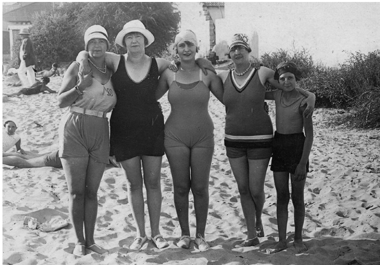
Отдыхающие на пляже. На девушках – разные виды пляжной спортивной обуви. Почтовая открытка. 1920–1930-е.