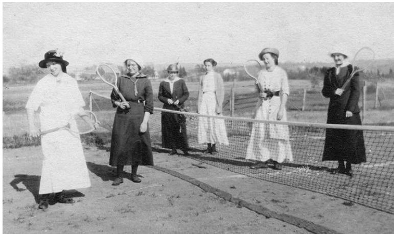
Дамы на теннисном корте. 1910-е.

Появление особой обуви для тенниса было обусловлено специфическими требованиями самой игры, которая начиная с 1870-х годов стала в Британии чрезвычайно популярной 20 . С одной стороны, теннисистам желательно было иметь возможность активно двигаться, поэтому специальные туфли, как правило, изготавливали более низкими, чем