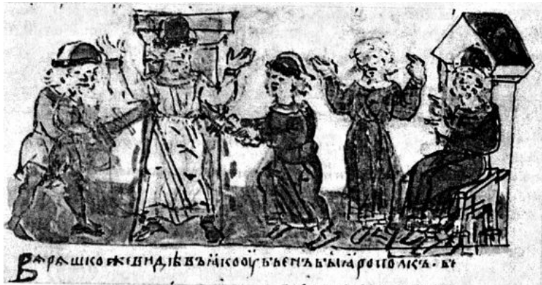
Убийство князя Ярополка двумя варягами. Миниатюра Радзивилловской летописи

Блуд, как передает летописный источник Татищева, ненадолго пережил своего господина. Вначале обласканный Владимиром, он вскоре навлек на себя гнев князя и был казнен. При этом Владимир будто бы помянул опальному воеводе его недавнее предательство: «Я тебе по обещанию моему честь воздал, яко приятелю, а сужю, яко изменника государя своего». Повесть временных лет ничего не сообщает о судьбе Блуда, но и не упоминает больше его имени.