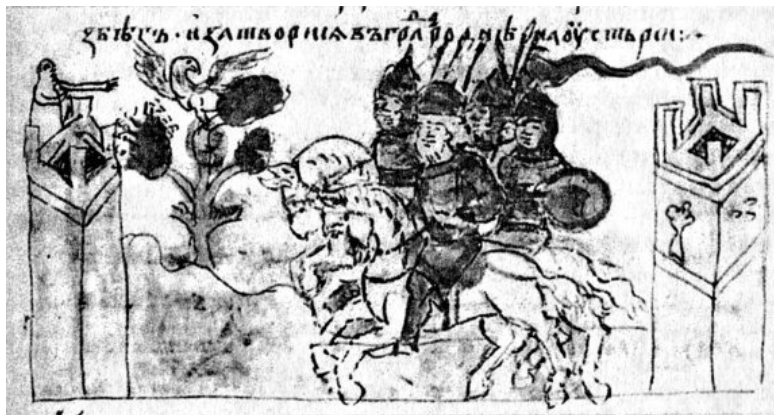
Отъезд киевского князя Ярополка из Киева в город Родню. Миниатюра Радзивилловской летописи

Чтобы оторвать Ярополка от сочувствовавшего ему окружения, Блуд якобы уговорил его бежать из Киева в город Родню, расположенный в устье реки Рось. Войско Владимира обложило его и там. По истечении какого-то времени в городе разразился страшный голод; «и есть притча и до сего дни: беда яко в Родне», добавляет летописец. Вот тут-то Блуд и посоветовал Ярополку сдаться на милость брата.