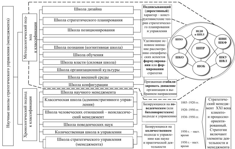
Рис. 4. Эволюция стратегического менеджмента