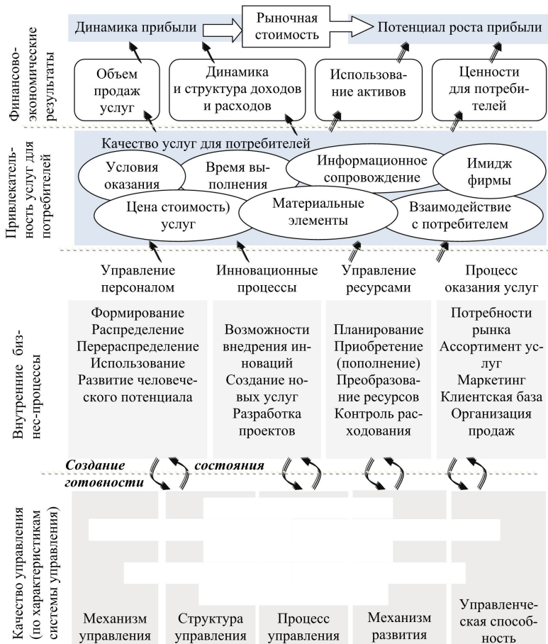
Рис. 1. Модель причинно-следственных взаимосвязей между совершенствованием системы управления и качеством услуг предприятия