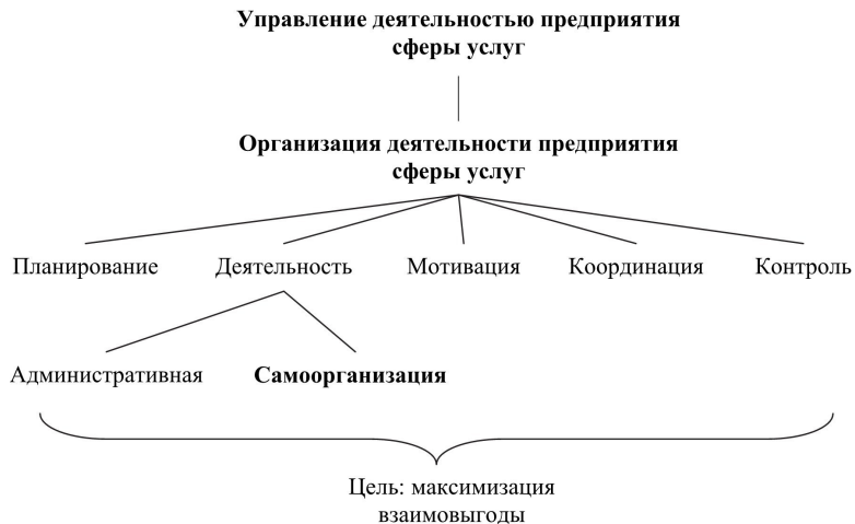
Рис. 4. Самоорганизация в системе управления

Важно соотнести понятия «управление», «организация» и «самоорганизация», поскольку они органически связаны (рис. 4).