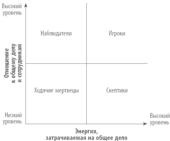
Рис. 1. Модель энергозатрат на работу

Модель представлена в виде двух осей (см. рис. 1), одна из которых (вертикальная) называется «Отношение к общему делу и сотрудникам». Чем лучше отношение работника к своим коллегам, тем дальше от исходной точки на вертикальной оси находится этот показатель. По такому же принципу на горизонтальной оси «Энергия, затрачиваемая на общее дело» измеряется объем энергии.