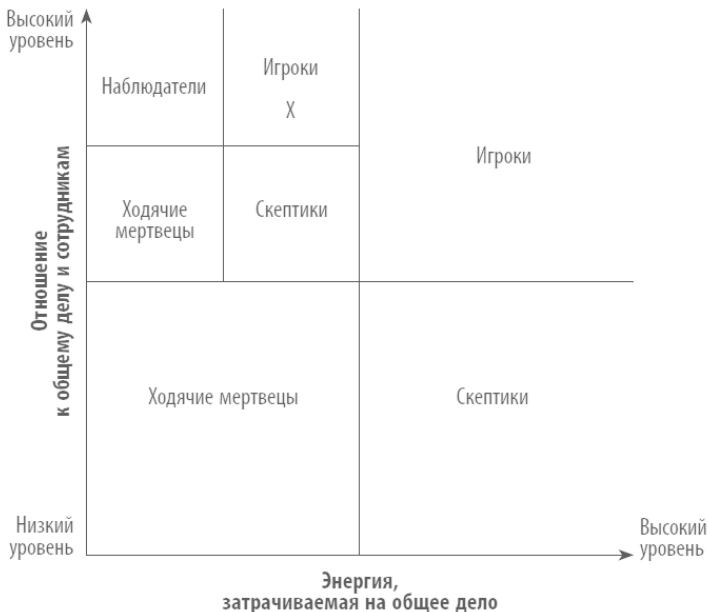
Рис. 2. Сектор наблюдателя-игрока (отмечен крестиком)

Тем не менее для такого типа работника не существует никаких препятствий для того, чтобы стать наблюдателем-игроком. Взгляните на рис. 2, и вы увидите, что верхний левый сектор разделен на четыре части, одна из которых отмечена крестиком – это и есть сектор наблюдателя-игрока. Бесспорно, думать и действовать одновременно сложно, но это вполне по силам многим.