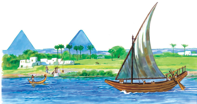
Вид на пирамиды с Нила

разбивали сады. Значительная часть населения была занята также скотоводством. К IV тысячелетию до нашей эры в Египте сложилось относительно развитое хозяйство.