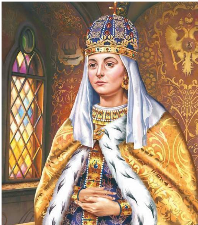
Евдокия Лукьяновна Стрешнева – жена царя Михаила и мать Алексея