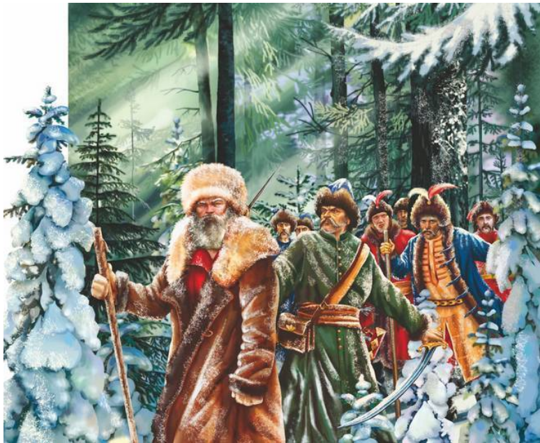
Подвиг Ивана Сусанина