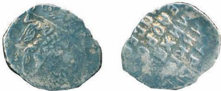
Русская старинная монета «чешуйка» времен Михаила Федоровича

Прежде всего Филарет постарался упрочить положение новой династии, женив Михаила. В невестах долго ходила Марья Хлопова. Обычно вокруг выбора невесты кипела борьба – ведь родственники царицы взлетали очень высоко. Марью, как-то раз переевшую сластей и оттого заболевшую, оговорили перед царем – сказали, что она неизлечимо больна. Михаил тотчас отказался от невесты. Тогда из множества девиц была выбрана Марья Долгорукая, но через год юная царица умерла – кто-то из зависти отравил ее. В 1626 году Михаил сыграл пышную свадьбу с Евдокией Лукьяновной Стрешневой, красивой, но незнатной дворянской дочерью, которая и родила ему сына Алексея – будущего царя.