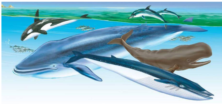
Косатка. Синий кит. Дельфины. Кашалот. Финвал.

Наиболее совершенное приспособление к жизни в водной среде, конечно, у китообразных – они полностью утратили связь с берегом, и их развитие протекало иначе, чем у ластоногих: задние конечности исчезли, а хвост (отсутствующий у ластоногих) превратился в мощный хвостовой плавник, своим назначением и формой напоминающий такой же плавник у рыб, только расположенный не в вертикальной, а в горизонтальной плоскости.