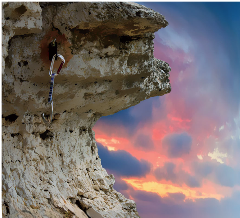
Воронов камень облюбовали альпинисты

Про княжну историкам ничего неизвестно, ибо в гробнице Тамерлана нет женского скелета. Опять же в летописях не сказано ни слова о дочери князя. Зато какая история! Может, это та княжна уговорила Тамерлана оставить сокровище под Ельцом – в Воргольких пещерах. Женские чары – сильная магия. С этим-то не поспоришь.