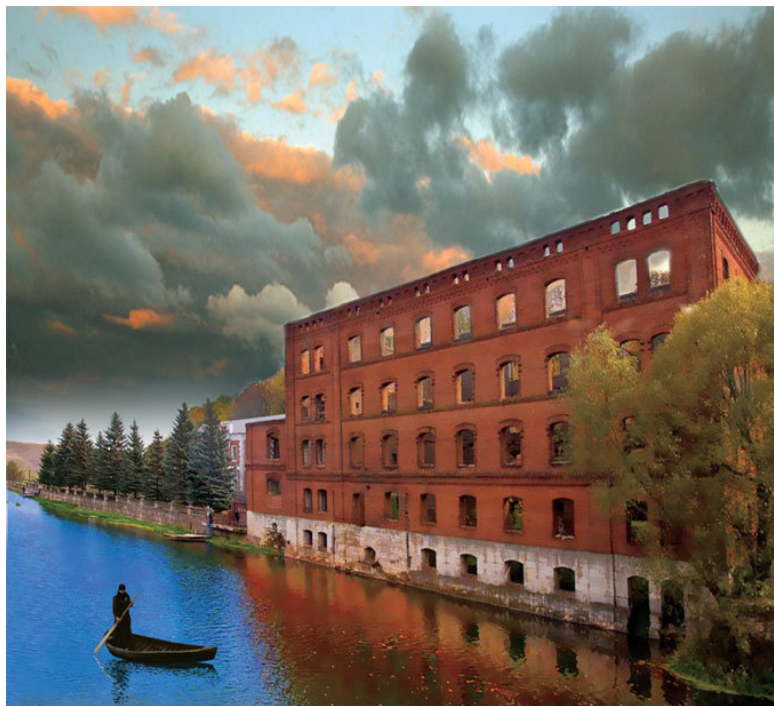
Старая водяная мельница на Ворголе