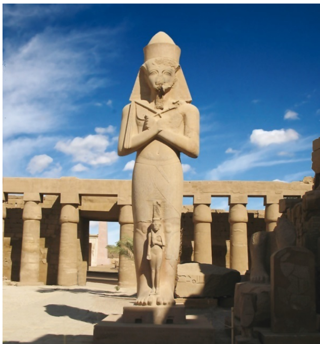
Храм с гипостильным залом в Карнаке