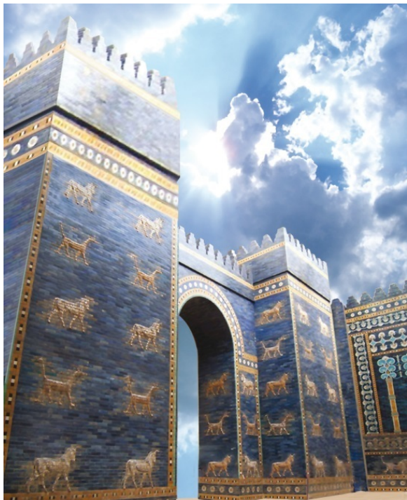
Ворота Иштар в Древнем Вавилоне

© В. А. Карачёв, составление серии, 2000–2019