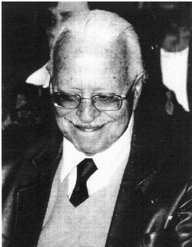
Джаммария в 90-е годы прошлого века