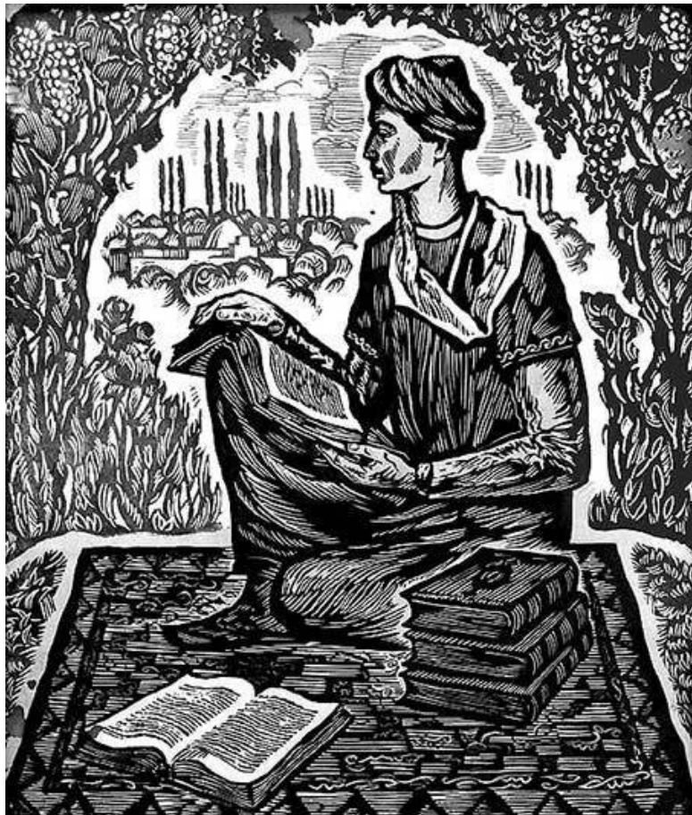
Авиценна. Экспонат музея Авиценны в Бухаре. Фото ре- продукции