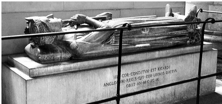
Саркофаг Ричарда Львиное Сердце. Фото репродукции