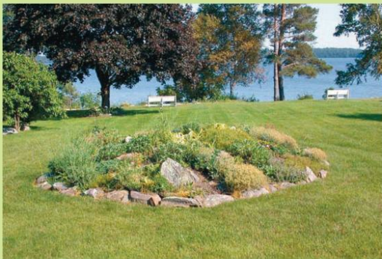
Типичный образчик «собачьей могилки»

В настоящее время альпийская горка стала настолько широко распространенным элементом садового дизайна, что в том или ином виде входит в обязательный «джентльменский набор» владельца любого сада. Нашими соотечественниками уже накоплен определенный опыт строительства альпинариев и рокариев. Многим эта наука далась нелегко. Неред-