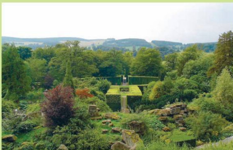
«Художественный» альпинарий в английском поместье Chatsworth House

ной, как правило, служил массивный вертикально стоящий камень или группа камней, символизировавших горный пик. По склонам на террасах укладывали более плоские, но тоже массивные камни, уравнивавшие композицию. Горные породы, используемые для построения такого рокария, ценились больше за декоративные качества, чем за их соответствие требованиям растений. Здесь туфы могли соседствовать с гранитами, слоистыми известняками и даже с «руинами» – обломками колонн и фриз. Нередко такие сооружения были столь искусственны, что напоминали не горные массивы, а декоративные пирамиды.