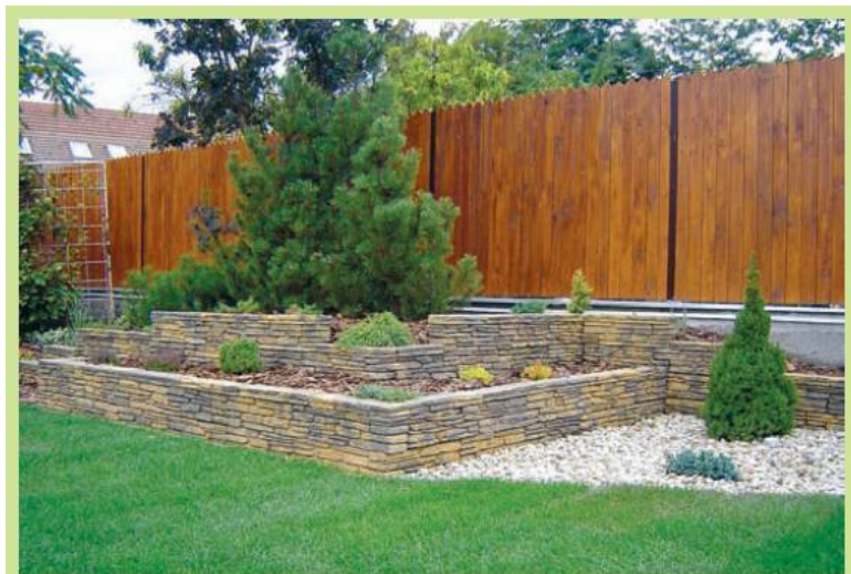
Несложный вариант архитектурного рокария

– это может быть рокарий плоского типа, миксбордер, бассейн или газон. На площадках террас обязательно высаживают низкорослые кустарники и медленнорастущие хвойные растения. Важную роль играют каскадные и почвопокровные формы хвойных, ковровые травянистые растения. В земляные ниши и щели подпорных стенок высаживают ампельные скальные виды: алиссумы, иберисы, колокольчики, полыни и им подобные.