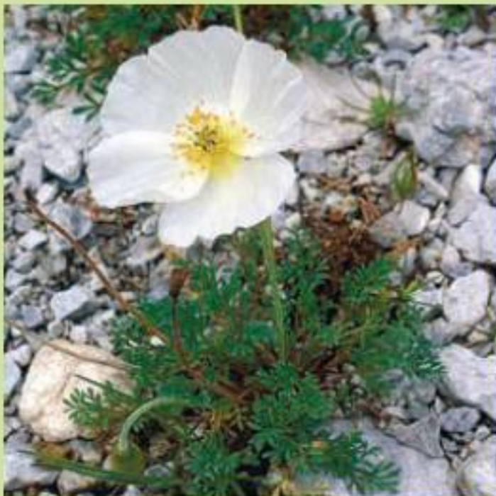
Горка «подносит к глазам» альпийский мак

Так как знаний по агротехнике выращивания альпийских и других горных растений было крайне мало, их выращивали исходя из требований местной растительности, что зача-