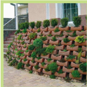
Керамические раковины-лотки для альпийской горки