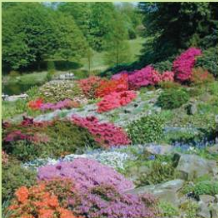
Каменистый сад в европейском стиле

Над этим можно было бы иронизировать, если бы не очевидный факт: альпинарий – действительно очень привлекательный объект садового убранства, который может