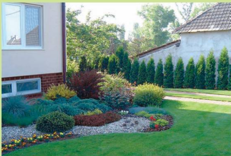
Каменистый садик у дома