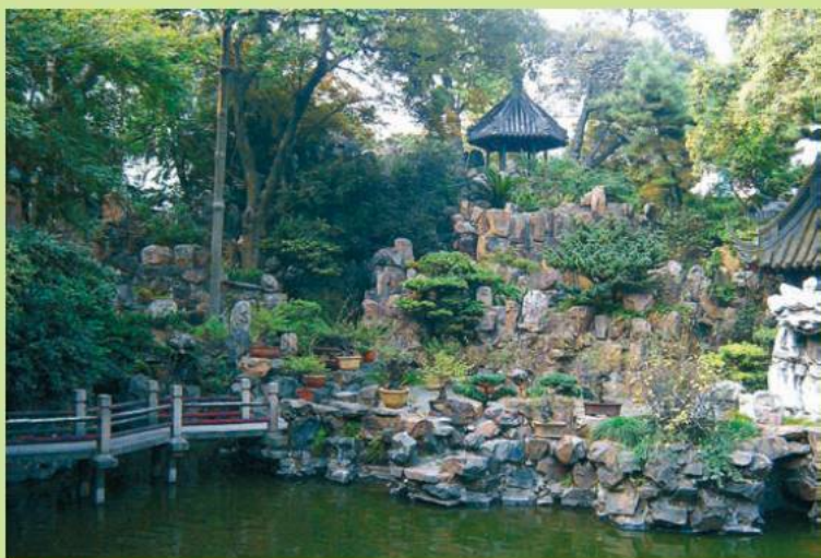
Сад Ю в Шанхае

Итак, что же такое «каменистый сад», в чем отличие альпинария от рокария и что же является главным – камни или растения?