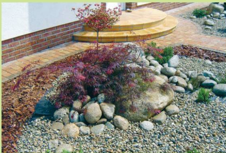
Вариации на тему каменистого сада в дачном исполнении

На фото сверху изображены: доминанта — клен (краснолистная форма), рядом карликовая сосна и туя, почвопокровные (седум), каменистые отсыпки контрастных цветов.