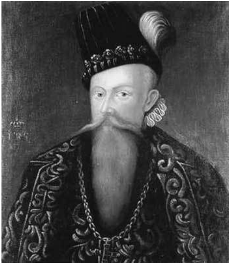
Юхан III, король Швеции.

А весной 1589 г. воеводу опять отправляют на юг.