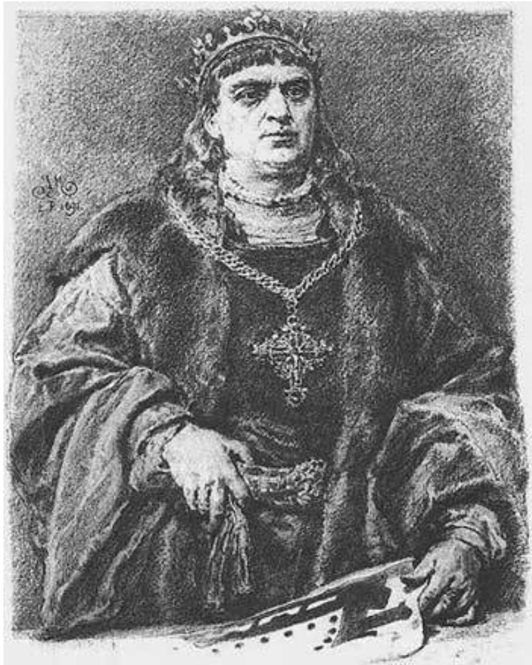
Сигизмунд I, король Польский и великий князь Ли-