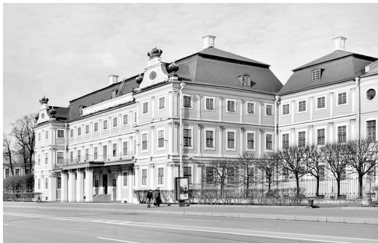
Дворец А.Д. Меншикова. Современное фото

Дворец Меншикова также поражал своей роскошью: золото, серебро, мрамор, дорогие сорта дерева, античные и итальянские скульптуры, венецианские зеркала, хрустальные люстры, гобелены и шелковые китайские обои. Часть этих интерьеров сохранилась до наших дней и любой может убедиться, что Меншиков умел жить с размахом.