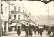
Садик у вокзала