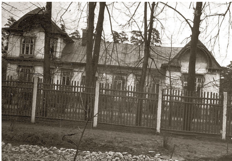
Начальная школа. Первый класс