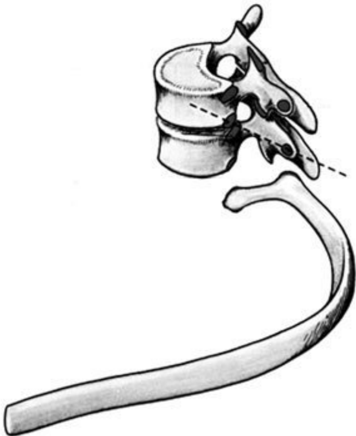
Рис. 2. Грудной позвонок

Суставные отростки расположены во фронтальной плос-