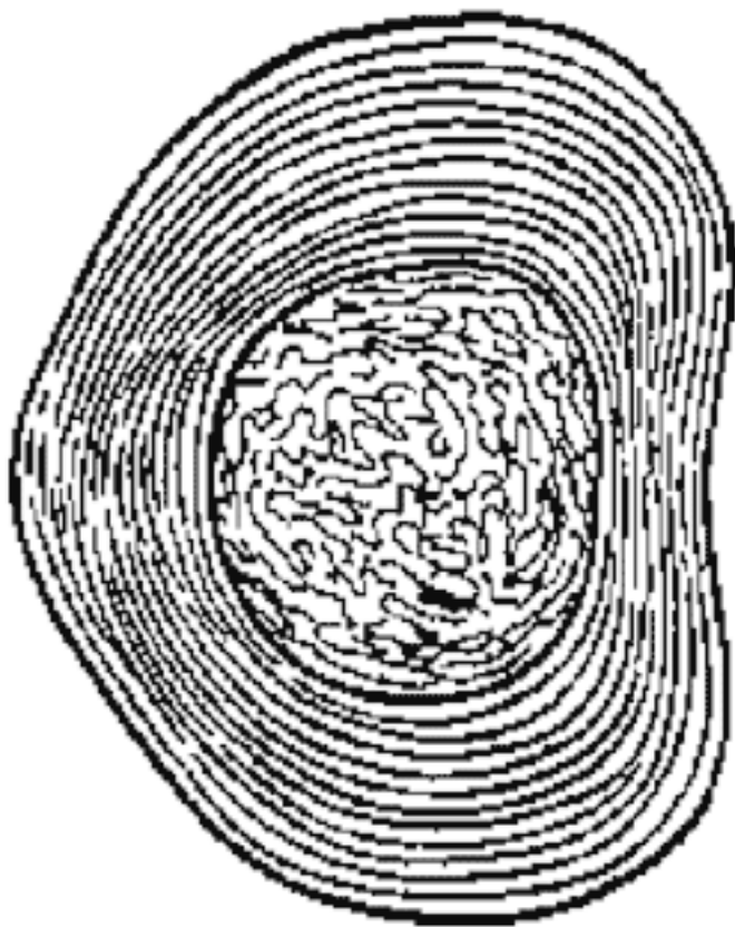
Рис. 4. Межпозвонковый диск

кой границы между фиброзным кольцом и студенистым ядром не наблюдается (рис. 4).