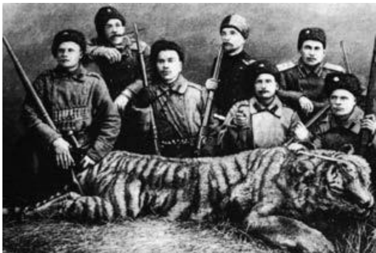
Казачи с убитым тигром

ся лазарет, в котором лечились как военнослужащие, так и местные жители, а также члены экипажей пришедших в бухту судов. В 1862 году военный пост был переименован в порт.