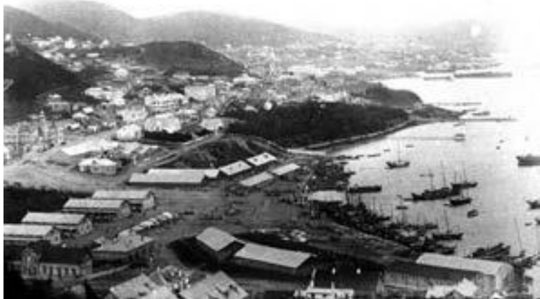
Владивосток в конце XIX века

В городе объявили военное положение, произвели обыски среди китайского населения, во время которых конфисковали большое количество оружия и боеприпасов. Арестовали 60 человек. Вскоре прибыло подкрепление, и бандиты были рассеяны. Ликвидация разрозненных групп вооруженных манз продолжалась до середины июля 1868 года. В историю эти события вошли под названием «манзовская война».