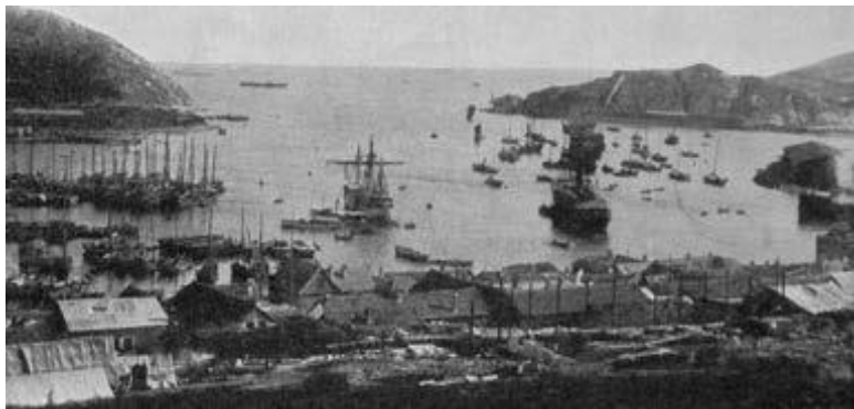
Порт-Артур. Вид на гавань и большой рейд

ном конфликте. Для содействия развитию экономических связей между двумя странами в Петербурге был создан Русско-китайский банк. В 1897 году началось строительство Маньчжурской железной дороги (впоследствии КВЖД), которая являлась южной ветвью Транссибирской магистрали и соединила Читу с Владивостоком и Порт-Артуром. Дорога принадлежала России и обслуживалась российскими подданными.