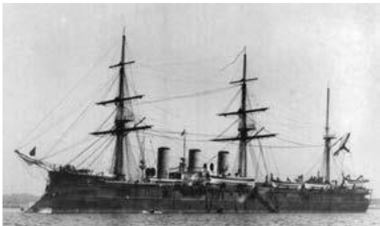
Броненосный крейсер «Память Азова»

В октябре цесаревич и сопровождающая его небольшая свита сели на поезд и отправились в Вену. Оттуда они добрались до Триеста, где стоял броненосный крейсер «Память Азова», на котором предстояло совершить вояж. В течение полугода наследник посетил все намеченные страны и сделал все предусмотренные этикетом визиты.