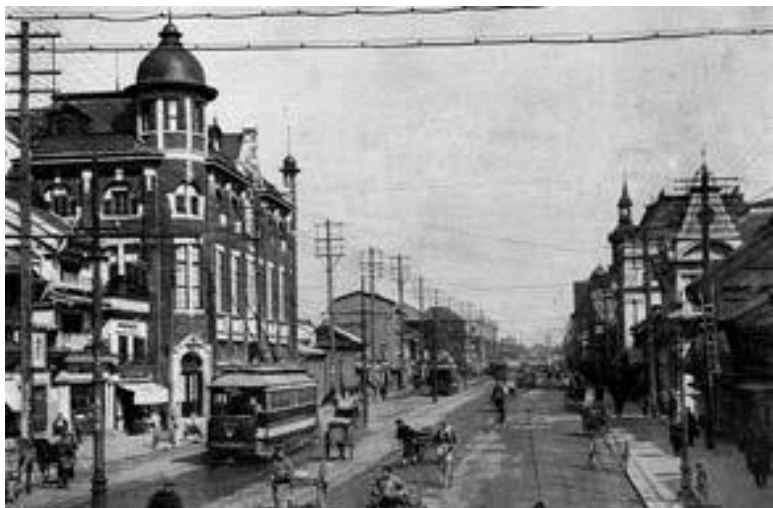
Улица в Токио

Проводимые в Японии реформы касались абсолютно всего: политического устройства, сельского хозяйства, промышленности, культуры. Составной частью преобразований явилась школьная реформа. Стало обязательным четырёх-летнее образование, и уже вскоре среди молодёжи практически не было неграмотных.