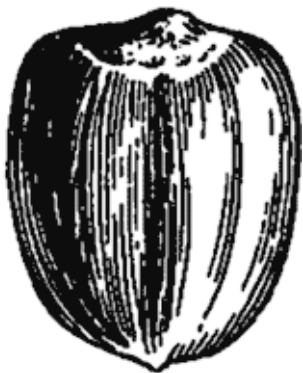
Рис. 3. Семена секвойи в натуральную величину (сле-