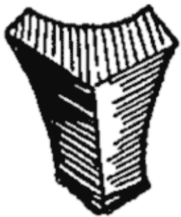
Рис. 2. Семена эвкалипта в натуральную величину (слева); семя эвкалипта, увеличенное в 10 раз (справа).