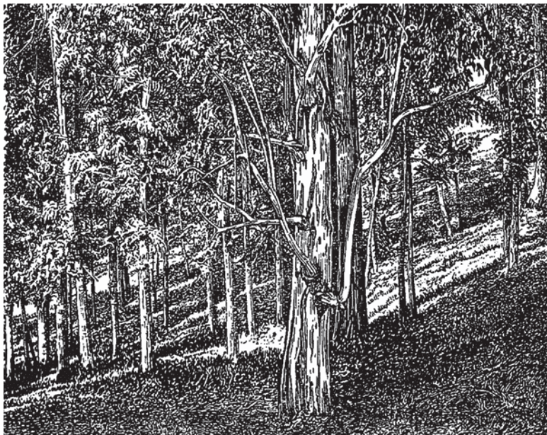
Рис. 4. Эвкалиптовая роща в Батумском ботаническом саду.

ним почти без задержки. В наших влажных субтропиках эвкалипты уживаются отлично, страдая лишь в наиболее холодные зимы.