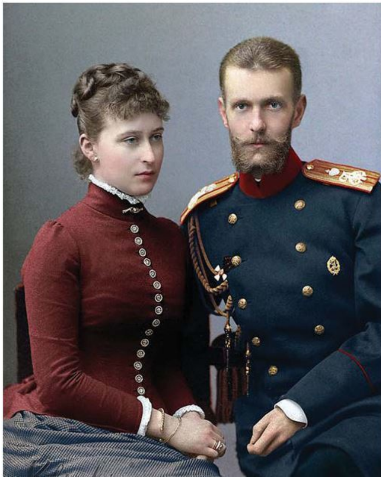
Великий князь Сергей Александрович со своей супругой великой княгиней Елизаветой Федоровной