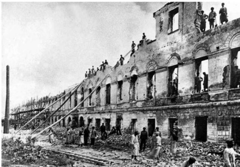
Ярославль. Тактика «выжженной земли»