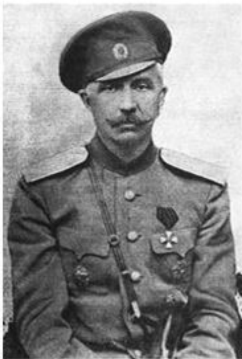
Петр Николаевич Краснов, генерал-майор Русской императорской армии