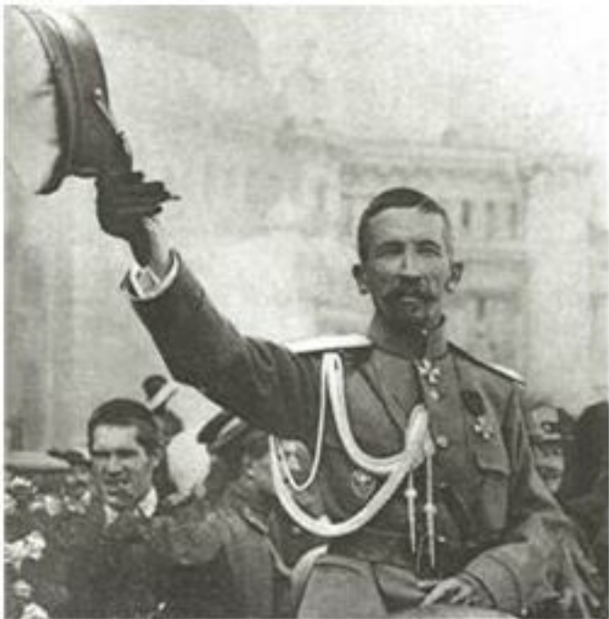
Генерал Лавр Георгиевич Корнилов в ходе наступления на Петроград

В конце августа 1917 года при наступлении генерала Л.Г. Корнилова на Петроград с целью установить военную диктатуру Б. Савинков, занимавший на тот момент должность военного губернатора Петрограда и исполняющего обязанности командующего войсками Петроградского военного окру-