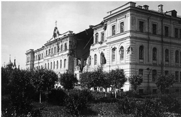
Руины домов и церквей Ярославля – последствия разрушений в ходе антибольшевистских восстаний