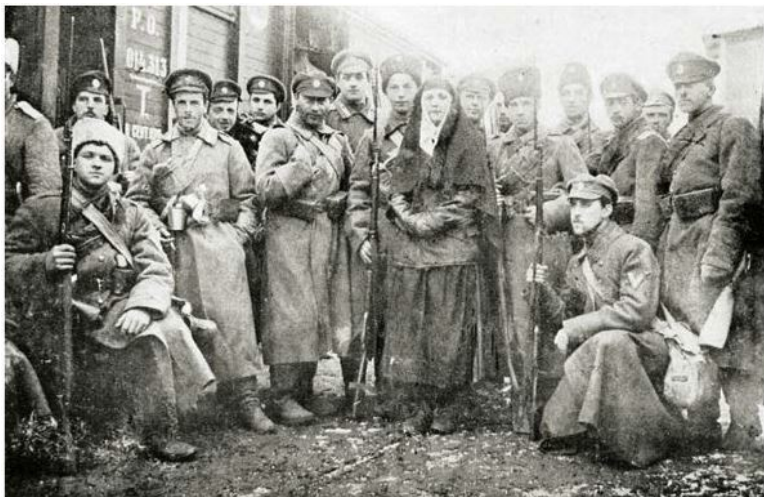
Пехотная рота Добровольческой армии, сформированная из гвардейских офицеров. Январь 1918 г.

В феврале – марте 1918 года Савинков организовал в Москве подпольный контрреволюционный «Союз защиты Родины и Свободы» (СЗРС), в который входили в основном офицеры и юнкера.