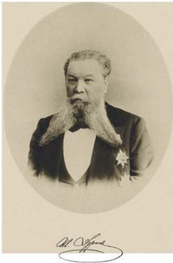
Иван Николаевич Дурново, русский государственный дея-