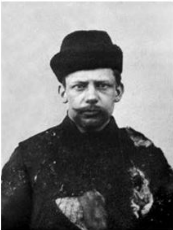
Иван Каляев после покушения на великого князя Сергея Александровича