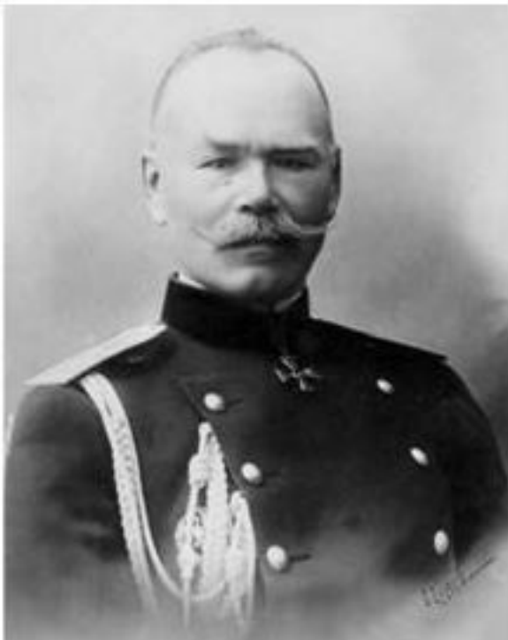
Генерал Михаил Васильевич Алексеев

Октябрьскую революцию Савинков встретил враждебно, считая, что «Октябрьский переворот не более как захват власти горстью людей, возможный только благодаря слабости и неразумию Керенского». Пытался помочь осажденному в Зимнем дворце Временному правительству, о чем вел пе-