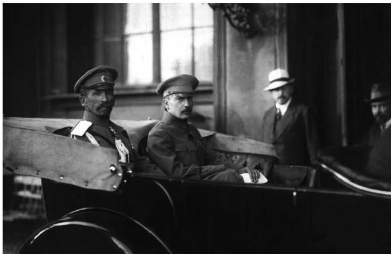
Б. Савинков с генералом Л. Корниловым покидают Зимний дворец после заседания

Кроме того, Б. Савинков был вызван в ЦК партии эсеров для разбирательства по так называемому «Корниловскому делу». На заседание он не явился, посчитав, что партия больше не имеет «ни морального, ни политического авторитета», за что и был исключен из партии эсеров.