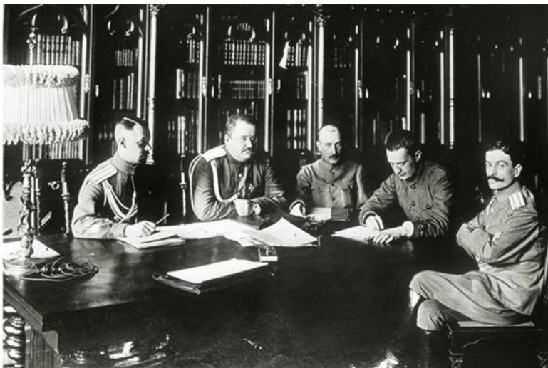
Б. Савинков (третий слева) и А. Керенский (второй справа)