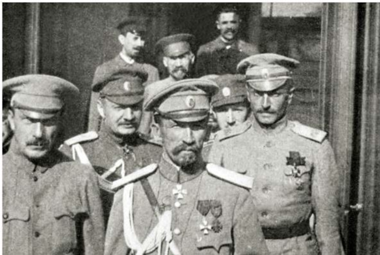
Б. Савинков с генералом Л. Корниловым во время «Корниловского мятежа» (Савинков крайний слева)