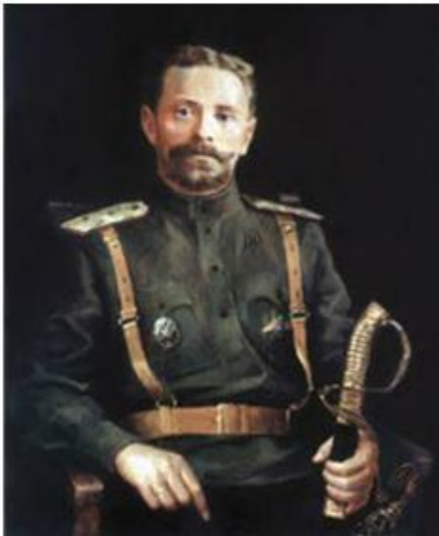
Генерал Владимир Оскарович Каппель

– У меня паспорт, выданный Северной коммуной. Теперь я нахожусь в пределах Нижегородской советской республики. Вы будете очень любезны, если выдадите мне от себя соответствующее удостоверение.