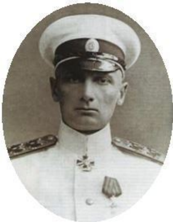
Адмирал Александр Васильевич Колчак

полнял во Франции должность представителя правительства А.В. Колчака. Вел переговоры с правительствами Антанты о помощи Белому движению. Организовывал обеспечение белой армии вооружением. Принимал участие в «Русской заграничной делегации» при обсуждении Версальского договора по итогам Первой мировой войны.