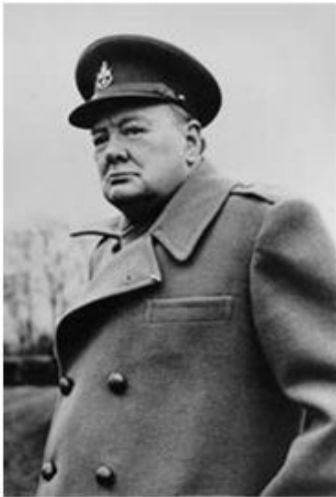
Премьер-министр Великобритании Уинстон Леонард Спенсер Черчилль

По оценке известного английского писателя Сомерсета Моэма, Савинков был одним из самых удивительных людей, каких ему доводилось встречать.