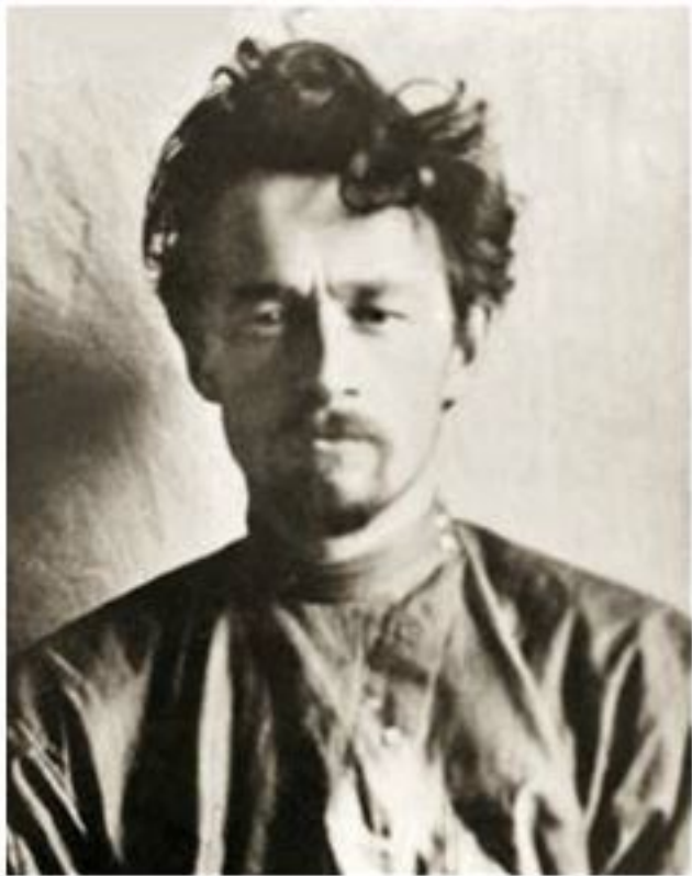
Егор Созонов, непосредственный исполнитель убийства В. Плеве