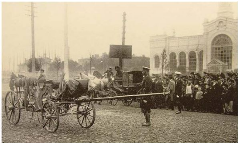
Площадь у Варшавского вокзала, остаток кареты министра В. Плеве (Санкт-Петербург)