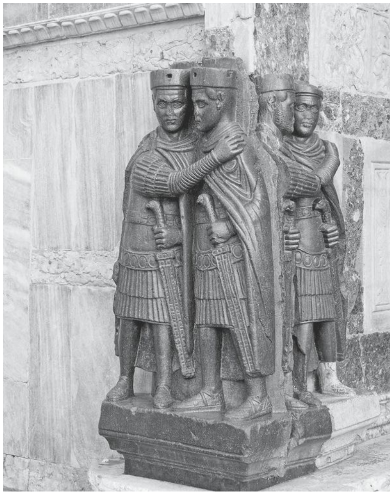
«Четыре тетрарха», скульптурная композиция обнимающих друг друга тетрархов, изготовленная из порфира в IV