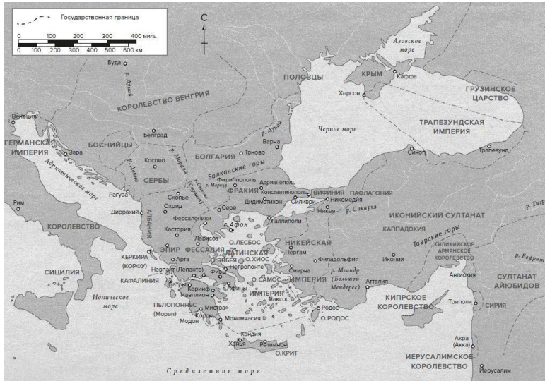
Карта 4. Византийский мир после 1204 г.