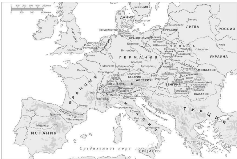
Карта 1. Европа в конце XVI века