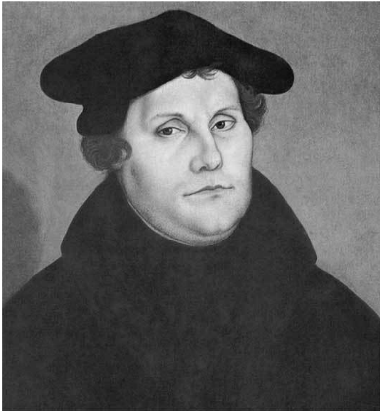
Портрет Мартина Лютера. Лукас Кранах Старший, 1529 г.

Мартин Лютер занимает центральное место в исторической памяти и на страницах этой книги. События 1517 г. считались Лютеровской Реформацией, хотя последние исследо-