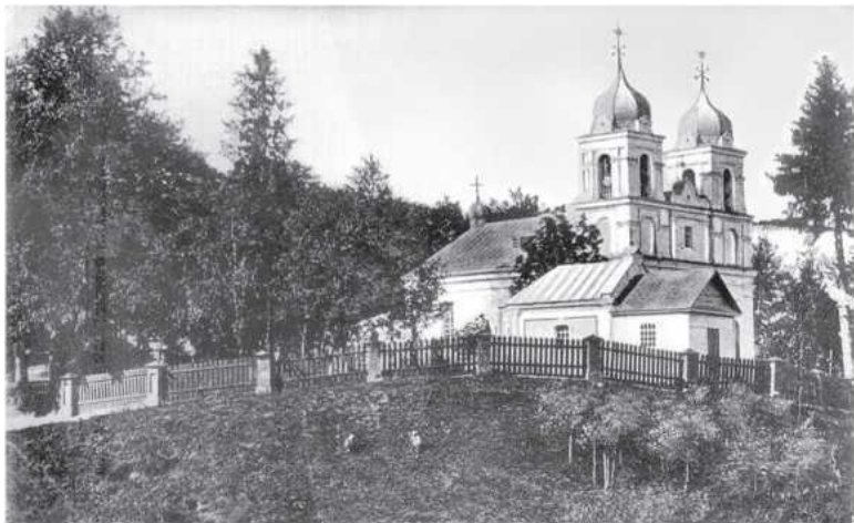
Велиж. Костёл св. Петра и Павла. Фото нач. XX века

В заречной части Велижа имелось четыре церкви, из которых войну пережила единственная в городе ц. Трёх Святителей. В нач. XX в. главные улицы города были выложены камнем, а тротуары – кирпичом. Приезжающие в город на ярмарки (в апреле и в августе) были обязаны везти с собой камни.