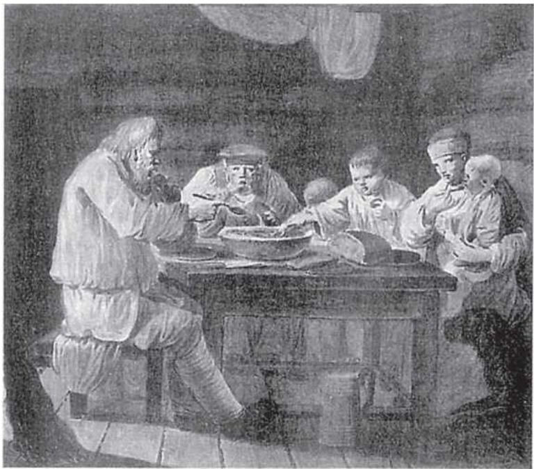
Крестьяне за обедом. Худ. И.А. Ерменёв. Ок. 1775 г.

Хорошим подспорьем был огород, где выращивали капусту и огурцы. Капусту квасили, а огурцы солили. Овощи занимали в крестьянском рационе первостепенное место. Они предписывались церковью по средам и пятницам, а также во время четырёх больших постов, длившихся по несколько недель.