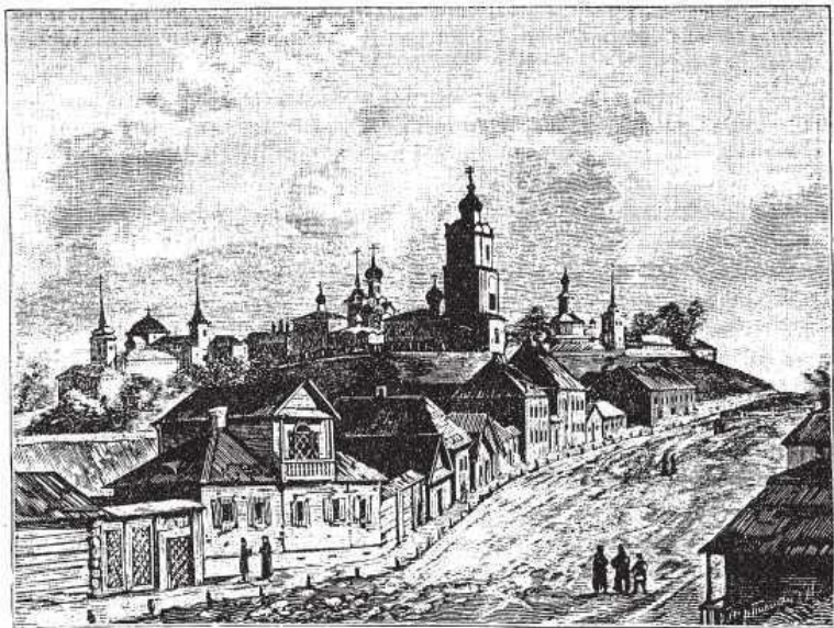
Город Вязьма. Старинная гравюра