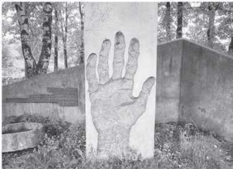
Памятник жертвам гетто