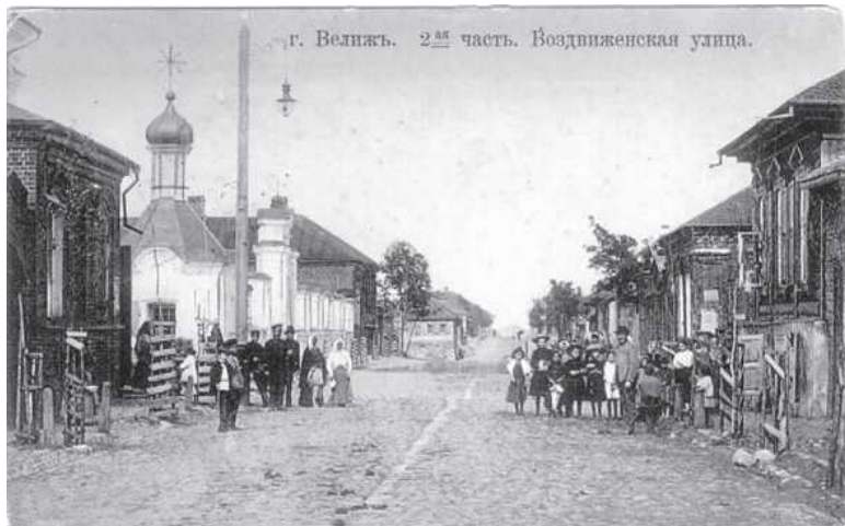
Велиж. 2-я часть. Воздвиженская улица. Фото нач. XX века

«Велижское дело» способствовало ухудшению в России отношения к евреям. Под его влиянием в разных городах стали возникать подобные же дела, появился указ царя о рекрутских наборах среди евреев. Кару несло всё еврейское население России, но особенно велижская община.