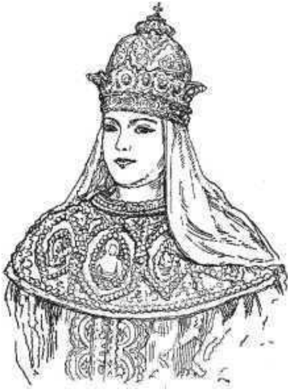
Анастасия Романовна, первая жена Ивана Грозного

1547 г. Анастасия Романовна. Коренная смолянка, она была младшей дочерью смоленского боярина Кошкина. Этот боярский род был древним и знатным.