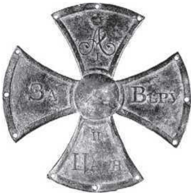
Крест ополченца 1812 г.

12143 чел. Но не было оружия. Ополченцев вооружали чем попало. Ружей не хватало, и было рекомендовано снабжать ополченцев пиками, как оказалось впоследствии, «бесполезными и безвредными».