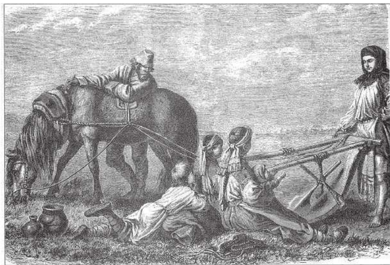
Пахари в Смоленской губернии. Гравюра XIX века

Тёмная, с закоптелыми стенами (потому что светится лучиной) изба. Тяжёлый воздух, потому что печь закрыта рано и в ней стоит варево, серые щи с салом и крупник, либо картошка. Под нарами у печки телёнок, ягнята, поросёнок, от которых идёт дух. Дети в грязных рубашонках, босиком, без штанов, смрадная люлька на зыбке, полное отсутствие какого-либо комфорта...».