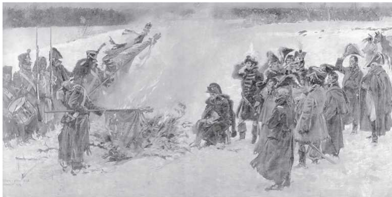
Сожжение знамён «Великой армии». Худ. А. Коссак. 1912 г.

Подобное произошло и с орлами. Несмотря на то, что по приказу Е. Богарне была уничтожена часть орлов, немалое их количество отбила русская армия. На территории Смоленской губ. было захвачено по крайней мере 9 знамён и 3 орла. Своё же знамя было утрачено только одно – в сражении при Валутино.