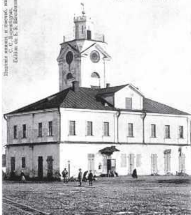
Ратуша в Велиже. Фото нач. XX века

г. Велиж. — Велиж. Parys, — Hôtel de Ville.