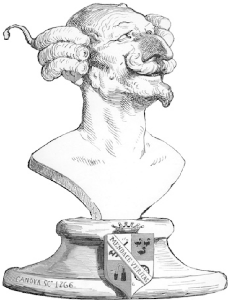
Пародийный портрет барона Мюнхгаузена работы Гю-