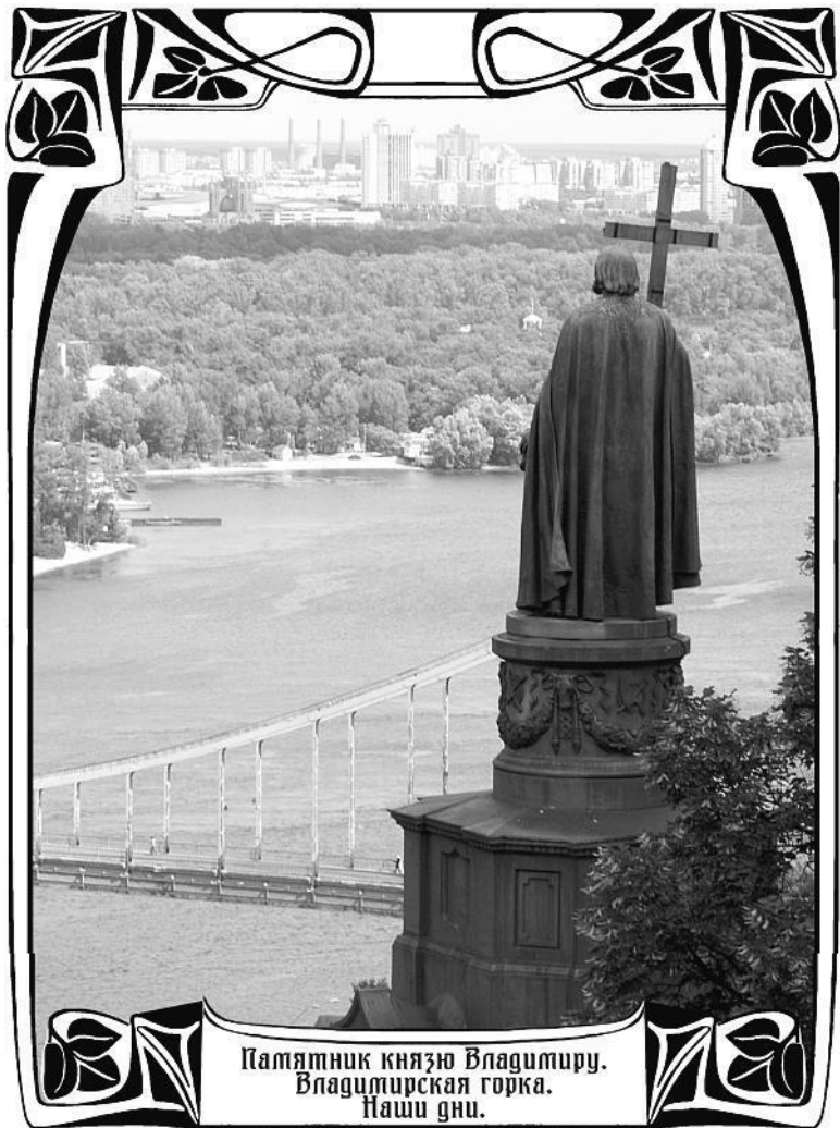
Памятник князю Владимиру. Владимирская горка. Наши дни.