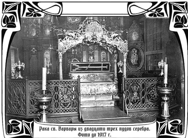
Рака св. Варвары из двадцати трех пудов серебра. Фото до 1917 г.