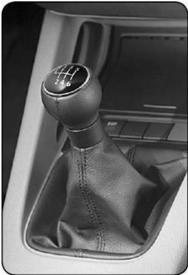
Рис. 1.1. Сегодня уже выпускаются автомобили с 6-ступенчатой коробкой передач