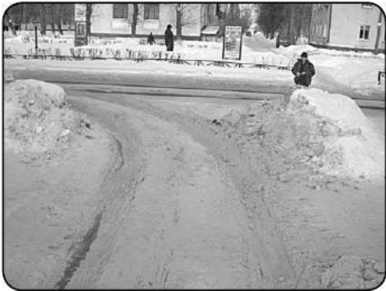
Рис. 1.4. На заснеженной дороге тормозить можно только двигателем

Приведу пример конкретной ситуации, когда ошибки, совершенные водителем при торможении, могут стать причиной серьезного дорожно-транспортного происшествия. Предположим, что водитель легкового автомобиля движется по закруглению дороги (причем дорожное покрытие является скользким), а перед ним следует другое транспортное средство, которое неожиданно начинает снижать скорость и останавливаться. Поскольку данная дорога имеет только по одной полосе для движения в каждом направлении, водитель