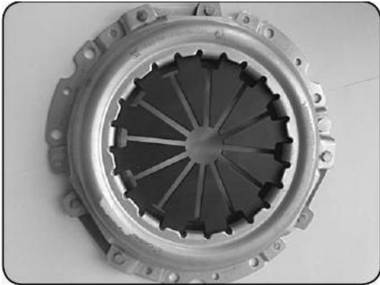
Рис. 1.2. Корзина сцепления

Не забывайте, что педаль сцепления является единственной педалью, которую водитель должен нажимать только левой ногой. С остальными педалями водитель должен работать только правой ногой.