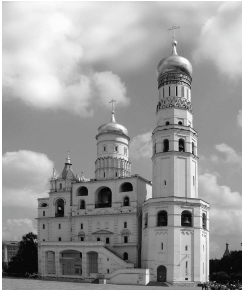
Колокольня «Иван Великий»

Многолепестковый храм в основании колокольни — ше-