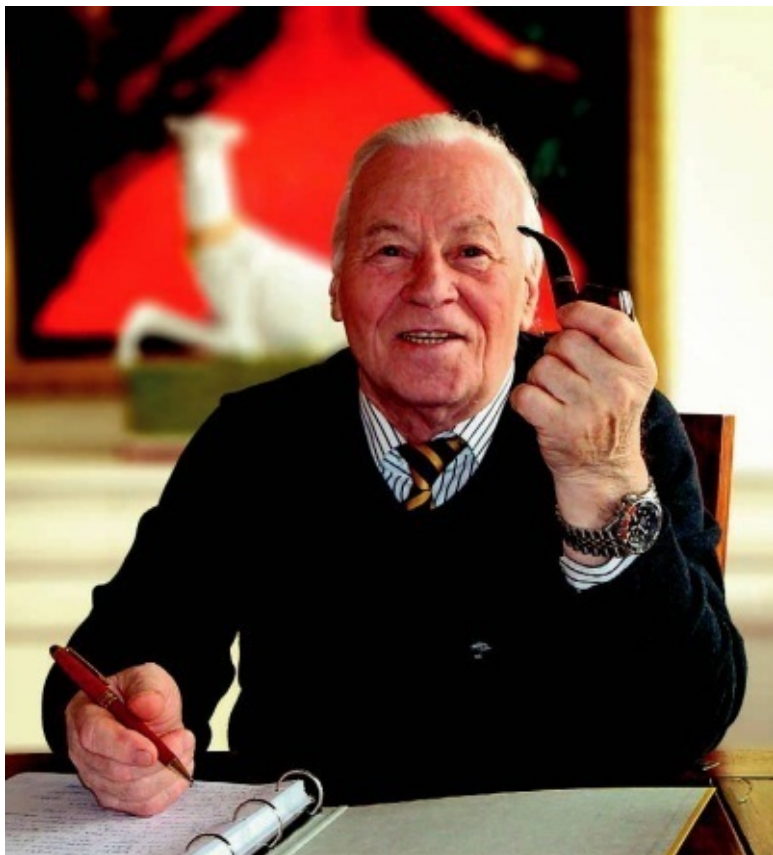
Фердинанд Фингер Фото 2010 г.