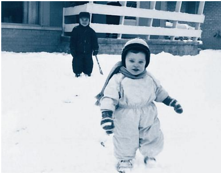
Крошка Нонни в полтора года. 1959 г.

Вспоминая о тех давних трагических днях, певица рассказывала: