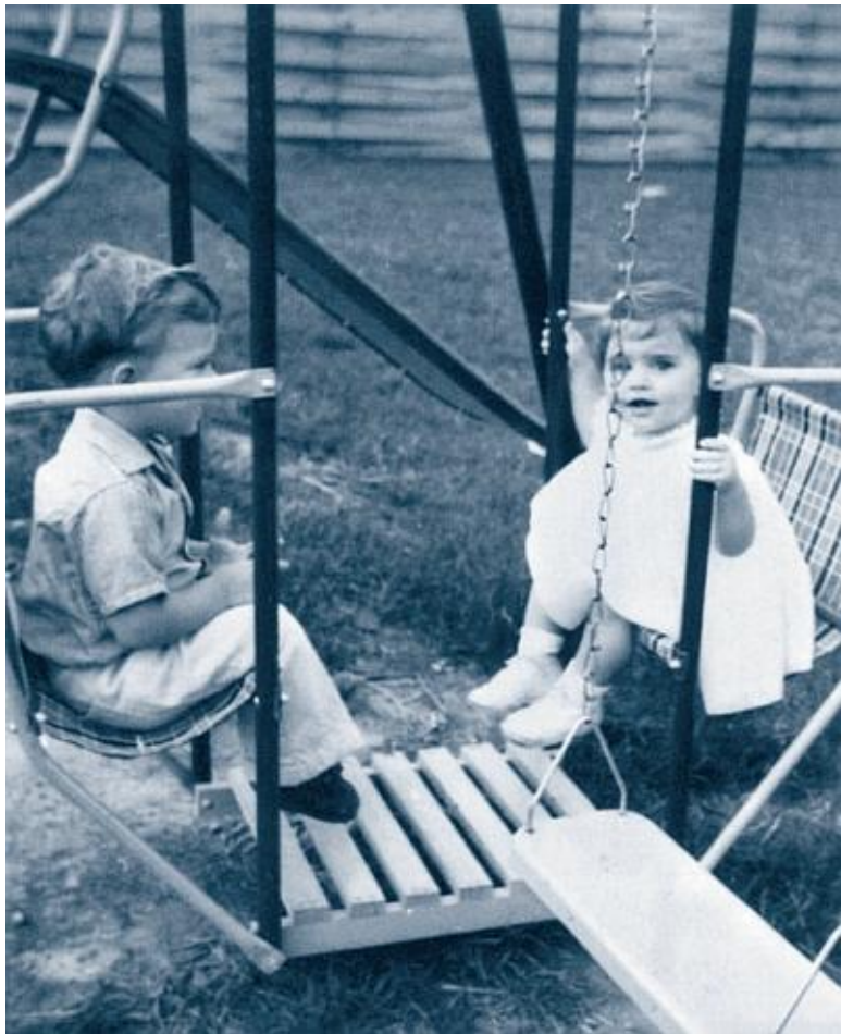
Мадонне 2 года