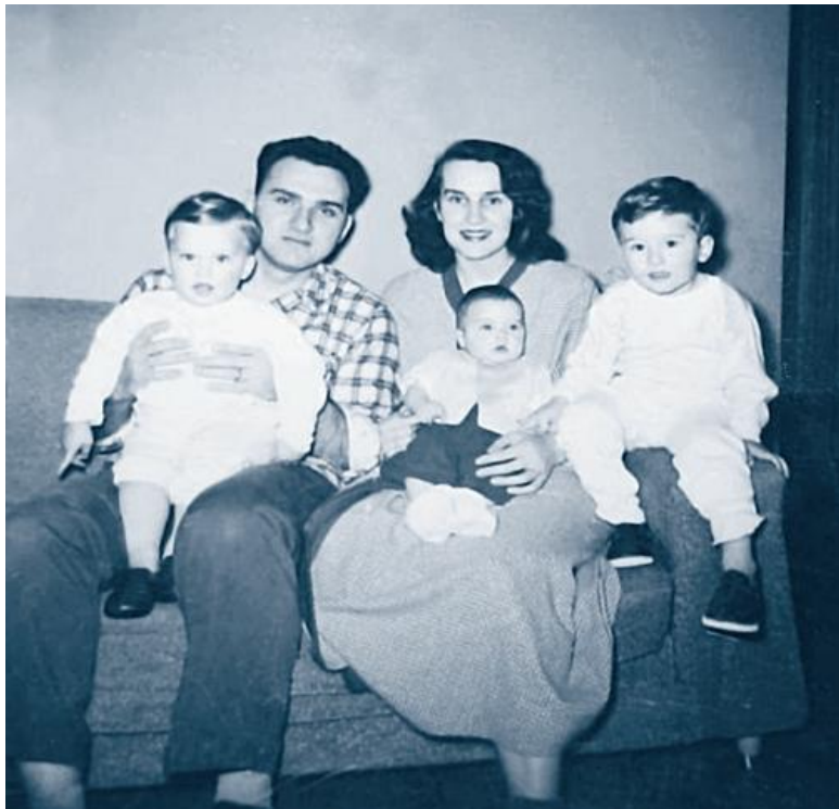
Семья Чикконе в 1959 году. Мама Мадонна еще жива...

После смерти матери «зависимость Мадонны от отца находилась на грани наваждения», как писал биограф певицы К. Андерсен. У ребенка появились фобии, начались кошмары, маленькая Мадонна еще больше тянулась к отцу, ища у него помощи и защиты. Стоило ей куда-нибудь выйти из до-