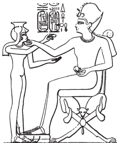
Рамсес III с фавориткой в гареме (Ленсий. Живопись

Пройдя через ворота, наш посетитель окажется в просторном внутреннем дворе, дальний конец которого пересекает еще одна, третья, стена, окружающая храм, дворец и гарем, а также большой комплекс внутренних дворов и строений. Низкие строения лепятся с трех сторон этой стены по обе руки от центральной проезжей дороги. Среди обитателей этого маленького городка, в котором жил царь со своими женами и многочисленными слугами во время своих визитов на левый берег Нила, попадались и жрецы, и светское население.