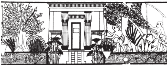
Дом и сад Ипуи ( Дейвис . Две гробницы Рамсесидов в Фивах)

полагались комнаты для одевания. В этих комнатах археологи нашли кирпичные сундуки, которые, предположительно, использовались в качестве шкафов для белья и одежды, а также что-то вроде буфетов, где, вероятно, держали еду и напитки. Оставшуюся часть здания занимали личные апартаменты владельца, в том числе купальни и туалеты. В одном углу купальной с облицованными камнем стенами была обнаружена каменная плита, окруженная низенькой кирпичной стенкой. Стоя рядом с ней, слуга поливал своего господина водой, после чего тот переходил в другой угол комнаты, где располагалось специальное ложе для массажа. Побеленный изнутри туалет находился за купальной. Там было сиденье, сделанное из известняка, с отверстием посередине; вся конструкция водружена на кирпичные контейнеры с песком.