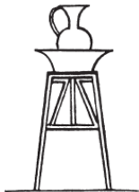
Кувшин и тазик на стойке ( Эрман. Жизнь в Древнем Египте )

Главное место в спальне, разумеется, занимала кровать. Некоторые из дошедших до нас образцов весьма незатейливы: деревянная рама, внутри которой натянута плетеная сетка, установлена на четыре ножки в виде коровьих копыт или львиных лап. Три поистине великолепные кровати были найдены в гробнице Тутанхамона; если смотреть с боков, они имели форму какого-либо животного – коровы, пантеры или гиппопотама – с сильно вытянутым телом. Помимо кровати, в спальне стояли деревянные шкафы для белья и одежды. Туалетные принадлежности – зеркала, гребни, шпильки для волос и париков – хранили в разнообразных ларцах и шкапулках, а в сосудах из обсидиана и слоновой кости держали косметические средства, притирания и ароматичные мази. В комнатах, где жили хозяйские дети (в первую очередь девочки), обычно были музыкальные инструменты и сундуки с игрушками.