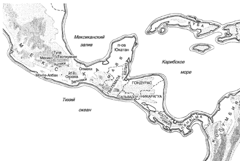
Карта Центральной Америки: территория майя и

В Центральной Америке имеются свои высокие горы. Высочайшая вершина Коста-Рики, Чиррипо-Гранде, простирается вверх на 12 589 футов, а высота вулкана Иразс равна 11 326 футам. Находящаяся в Гватемале гора Тахумулько имеет высоту 13 616 футов, а высота нескольких вулканов превышает 12 000 футов. К северо-западу, за перешейком Теуантепек, горы Мексики еще выше: вулкан Попокатепетль возвышается над городом Мехико на 17 887 футов, а Ситлалтепетль неподалеку от города Орисаба – на 18 701 фут.