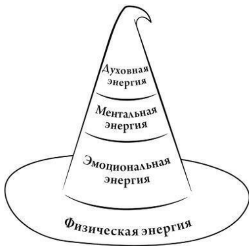
Рис. 1. Шляпа ведьмы: иерархически организованные типы человеческой энергии

ем, были впервые рассмотрены психологом Абрахамом Маслоу, который разработал пирамиду, изображающую иерархию человеческих потребностей 9 . Чтобы она стала более узнаваемой для единомышленников, возьмем вместо пирамиды шляпу ведьмы (рис. 1).