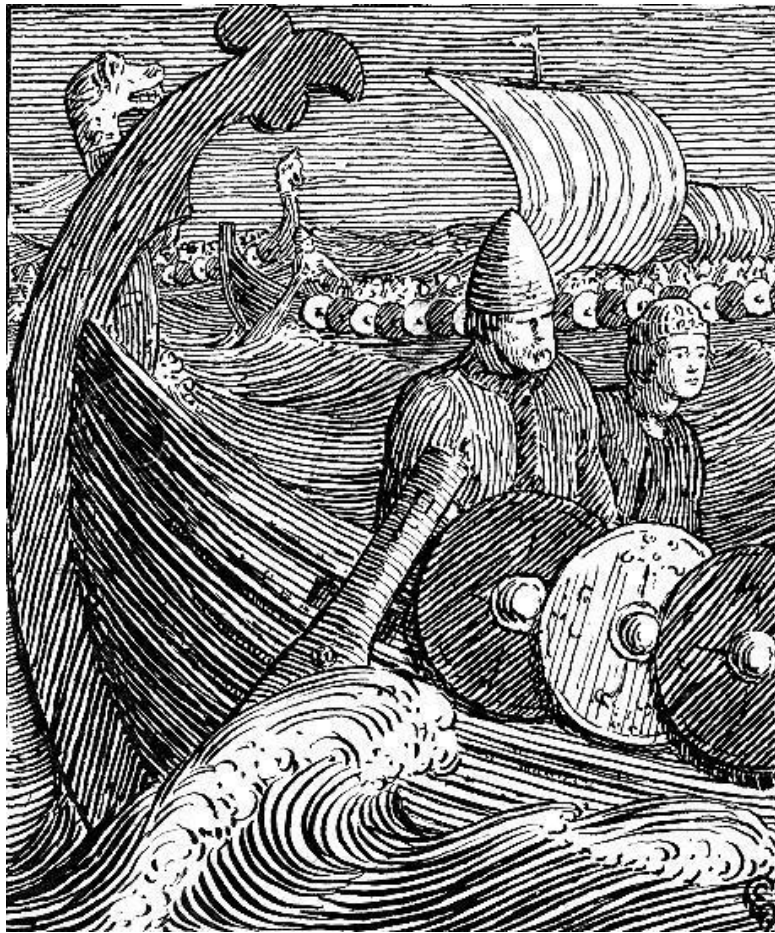
Х. Эгидиус. Иллюстрация к «Саге об Олафе Святом»

Корабли причаливают, и люди сходят на берег. Никого не