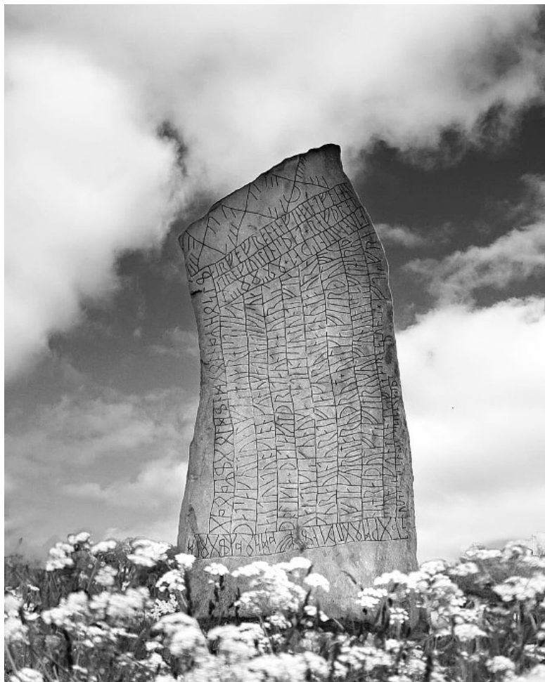
Рунический камень. Швеция, ок. IX в.