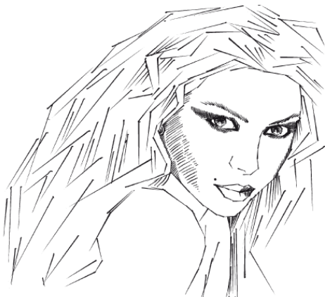
Рис. 1. Макияж в Древнем Египте

Большое значение придавалось личной гигиене и уходу за телом. Например, Клеопатра принимала ванны из молока ослицы, которое смягчало ее кожу. Люди знатного происхождения смазывали свое тело благовониями и ароматическими маслами. Интересно, что не только мужчины, но и женщины брили головы, чтобы можно было носить роскошные парики. Если вы посмотрите на изображение царицы Нефертити, то увидите, что свои глаза она подчеркивала тушью, а губы – порошком из глины.