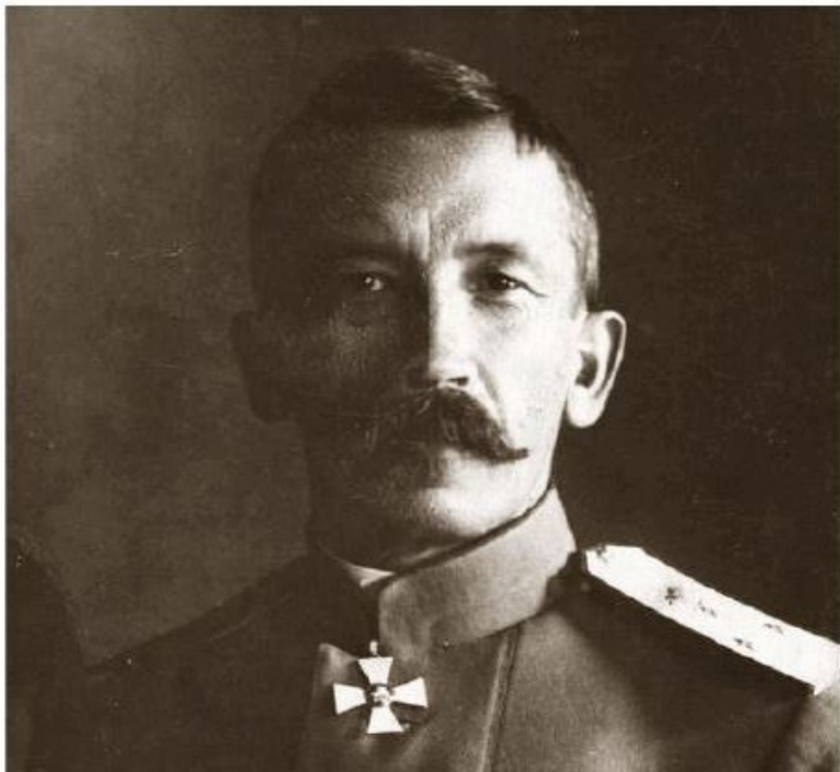
Лавр Георгиевич Корнилов

Если вернуться в далекий уже 1917 год, то тогда матросская масса в своем подавляющем большинстве всегда выступала единым фронтом. Это был настоящий феномен единства и братства. С первых дней Февральской революции матросы дружно взялись за демократизацию флота, так как они ее понимали с убийствами адмиралов и офице-