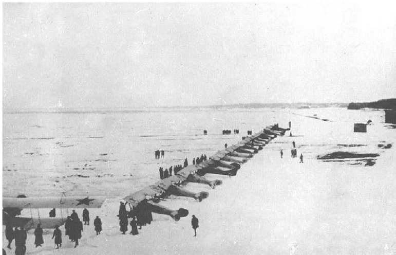
Авиагруппа, собранная в Ораниенбауме для бомбардировки Кронштадта

В феврале сообщения комиссаров о проявлениях недовольства продовольственной разверсткой на кораблях и в береговых частях Кронштадта становятся почти повсеместными. Относительно личного состава Кронштадтской крепости Побалтом было сделано следующее общее заключение: «В частях крепости, несущих гарнизонную службу, чувствуется усталость. Волнующие вопросы: неправильная разверстка хлеба на местах, необеспеченность семей, недостаток обуви и др.»