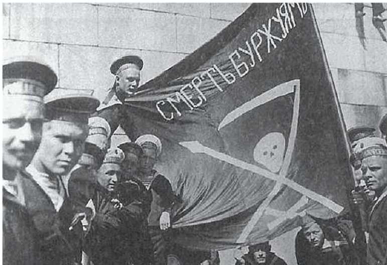
Моряки с линкора «Петропавловск» в 1917 году

Анархисты Кронштадта, выпускали собственный журнал «Вольный Кронштадт». Из передовицы журнала: «Просыпайтесь! Просыпайся, человечество! Рассей тот кошмар, что окружает тебя... Положи конец дурацкому поклонению земным и небесным богам! Скажи: «Хватит! Я встаю! И вы обретете свободу! Да здравствует анархия! Пусть трепещут паразиты, владельцы и попы – все сплошь обманщики!» С осени 1920 года в Кронштадте, на почве роста антибольшевизма, начали активизироваться не только анархисты-коммунисты и анархисты-синдикалисты, во главе с Х.З. Ярчуком, но и анархисты-экстремисты. Так в прокламации, обнаружен-