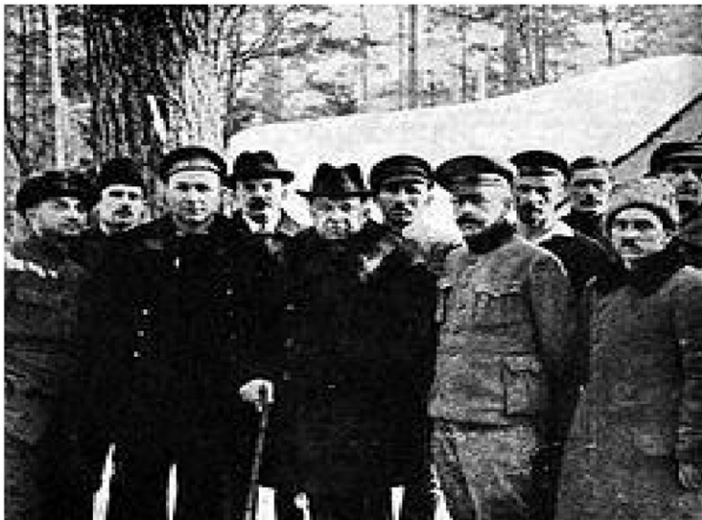
Степан Петриченко среди русских эмигрантов в Финляндии в 1921 году