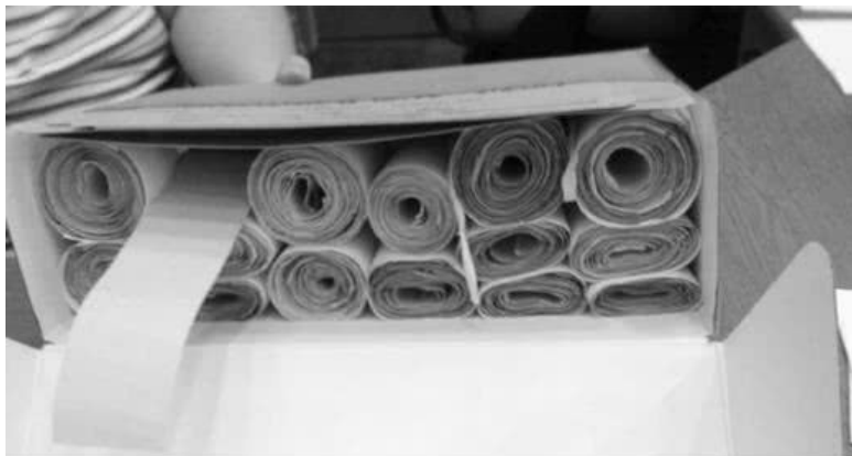
Черновики «Сирен Титана».