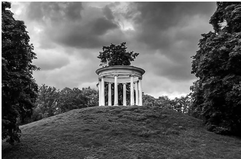
Одна из усадебных беседок венчает гору Парнас

сударя, что разговоры о торжестве ещё долго носились по всей Москве. Восторги и похвалы дошли и до польского короля Станислава Августа Понятовского, и он с радостью и любопытством посетил «Увеселительную усадьбу Шереметева» 7 мая того же года. После пышных торжеств по случаю визита короля почетному гостю и его свите был представлен музыкальный спектакль, в котором участвовал весь домашний театр графа Шереметева, более 300 человек. После спектакля последовал роскошный бал, а затем – не менее роскошный ужин.