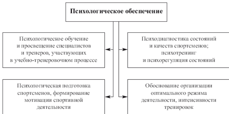
Рис. 1.2. Структура психологического обеспечения на начальном этапе формирования [224, с уточнениями автора]

Наиболее близким, по нашему мнению, определением для понимания современной системы психологического обеспечения с научной точки зрения, является подход Н.В. Цзен и Ю.В. Пахомова, предложенный ещё в 1985 г., который характеризовал психическую сторону спорта как внутреннюю составляющую процесса подготовки, лежащую «за пределами трехмерной схемы (физическая, техническая, тактическая подготовка) и образующую своеобразное четвертое измерение» [349].