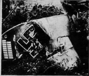
На снимках: (в центре) советский истребитель на боевом задании, (слева и справа) — сбитые летчиками-североморцами машины фашистских асов-бандитов.