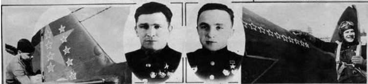
9 сбитых фашистских самолетов — таков боевой счет этой машины.