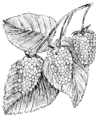
Рис. 1. Ягода малины

стой и черной малины. Имеет тот же характер роста, что и черная малина, и размножается тем же самым способом. Распространена в Америке.