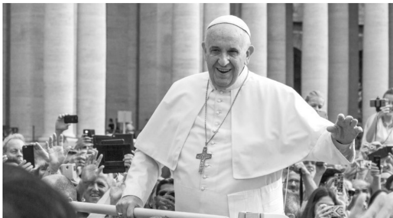
Папа Франциск, 266-й Папа Римский.