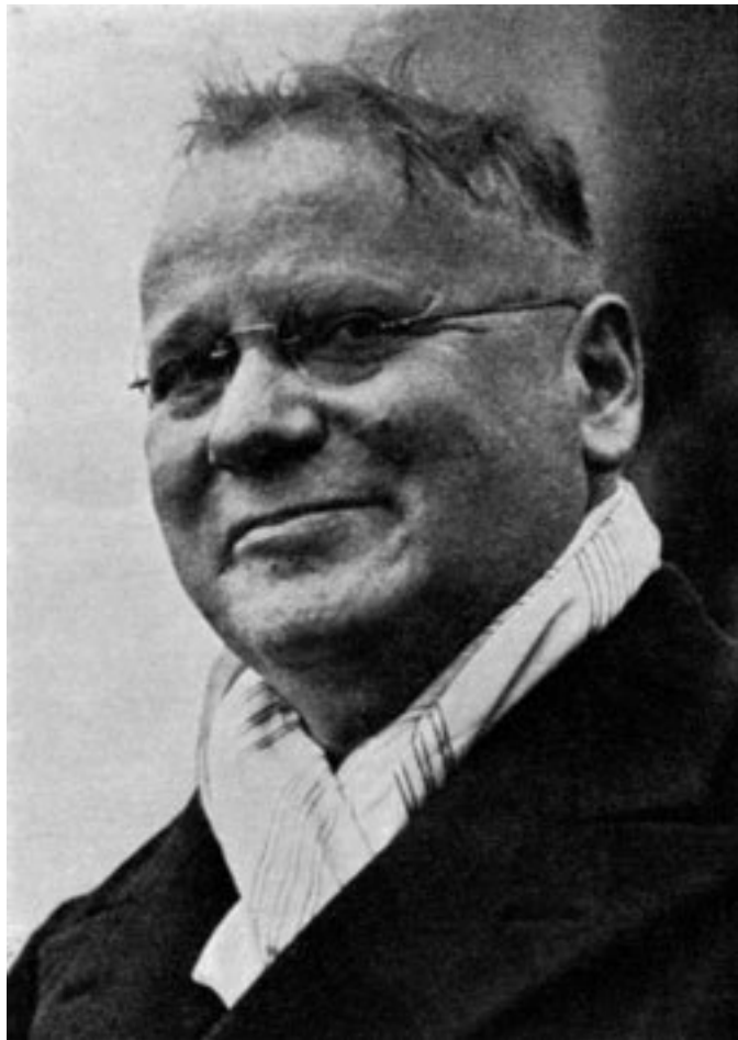
Максим Литвинов, народный комиссар по иностранным делам СССР. Журнал Newsweek. 1939. 15 мая.