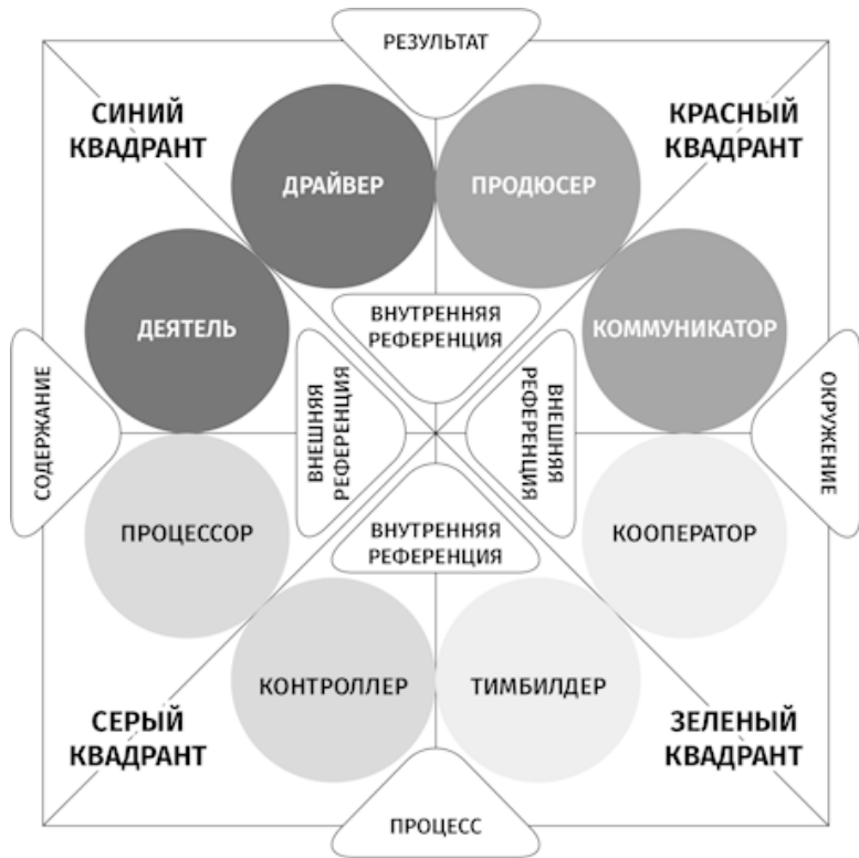
Рис. 2. Комплексная типология метапрограмм

У нас получилось восемь типажей. Ниже я объясню логику их выделения и почему я так их назвала.