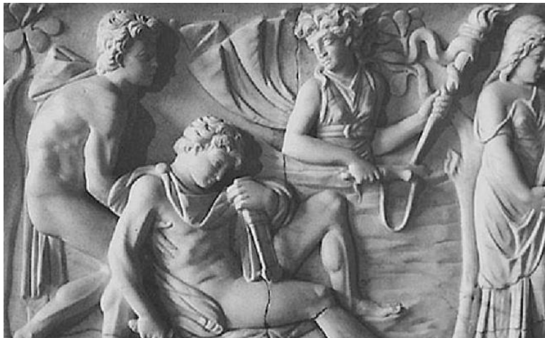
Фурии смотрят на Ореста, поддерживаемого Пиладом. Фрагмент римского рельефа на саркофаге, 130–140 гг.

Может быть, кому-то может показаться мое объяснение древнерусского названия нынешнего Севастополя несколько натянутым. Пусть так! Но, согласитесь все же, что нельзя не признать несомненное соответствие смысла древних названий самой сущности места! К тому же иных, сколько-нибудь доказательных объяснений слову Корсунь, я еще нигде и никогда не встречал. Что ж, может быть, наши далекие предки не хуже древних греков почувствовали не только явную необычность этого края, а его великую будущность, и именно потому дали имя, вполне соответствующее его предназна-