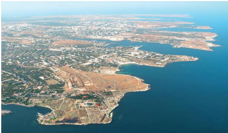
Гераклейский полуостров, на переднем плане Херсонесское городище, вид с востока

Я не знаю еще ни одного человека, который, побывав, хоть один раз в Севастополе, не сохранил бы о нем самые яркие воспоминания. И дело здесь вовсе не в том, что город расположен на берегу теплого моря, ведь курортных мест у нас не счесть! Отношение же к Севастополю совершенно иное, оно возвышенное и восторженное.