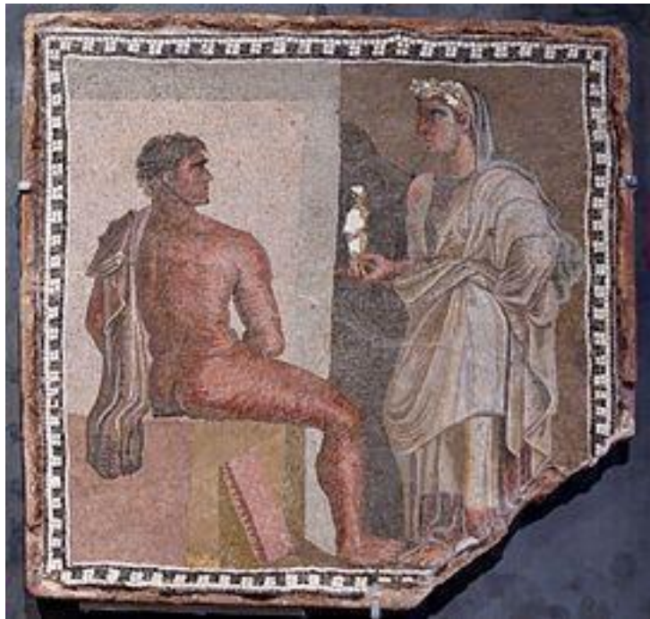
Римская мозаика «Орест и Ифигения» II–III века н. э. Капитолийские музеи

Но сейчас нас интересует несколько иной аспект этой древней истории, скорее даже ее последствия. Неожиданные. Несмотря на то, что действия Ореста и Пилада принесли таврам немало горя после их удачного бегства в Грецию, оба они стали весьма почитаемы у тавров. Сразу же возникает закономерный вопрос: почему? Ответ, впрочем, прост. Бо-