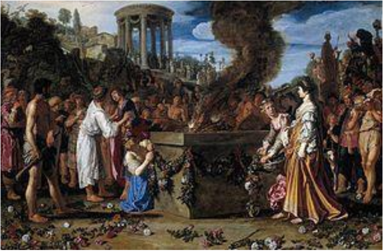
«Ореста и Пилада ведут к жертвенному алтарю». Питер Ластман.

Корчаков (Корсаков), что в переводе на наш язык приблизительно означает «божества-покровители дружбы»... Этому северному слову более двух тысяч лет...»