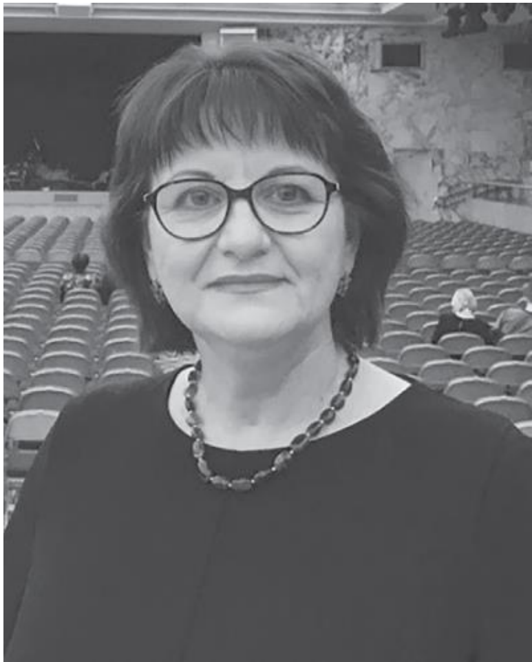
Журналист и писатель из Владивостока. Окончила фи-