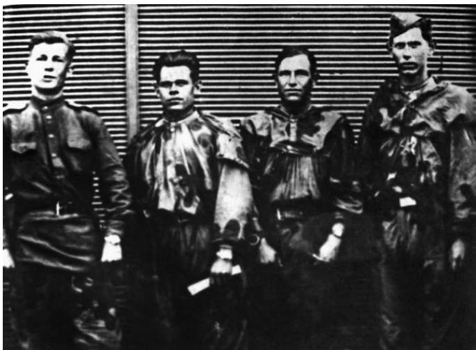
Разведчики 303-й стрелковой дивизии